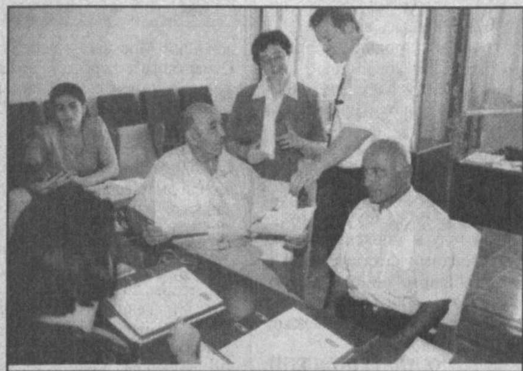
вистам приходится многому учиться заново.

Проведение же данных исследований имело целью выяснить степень осведомленности населения в вопросе сохранения своего здоровья.