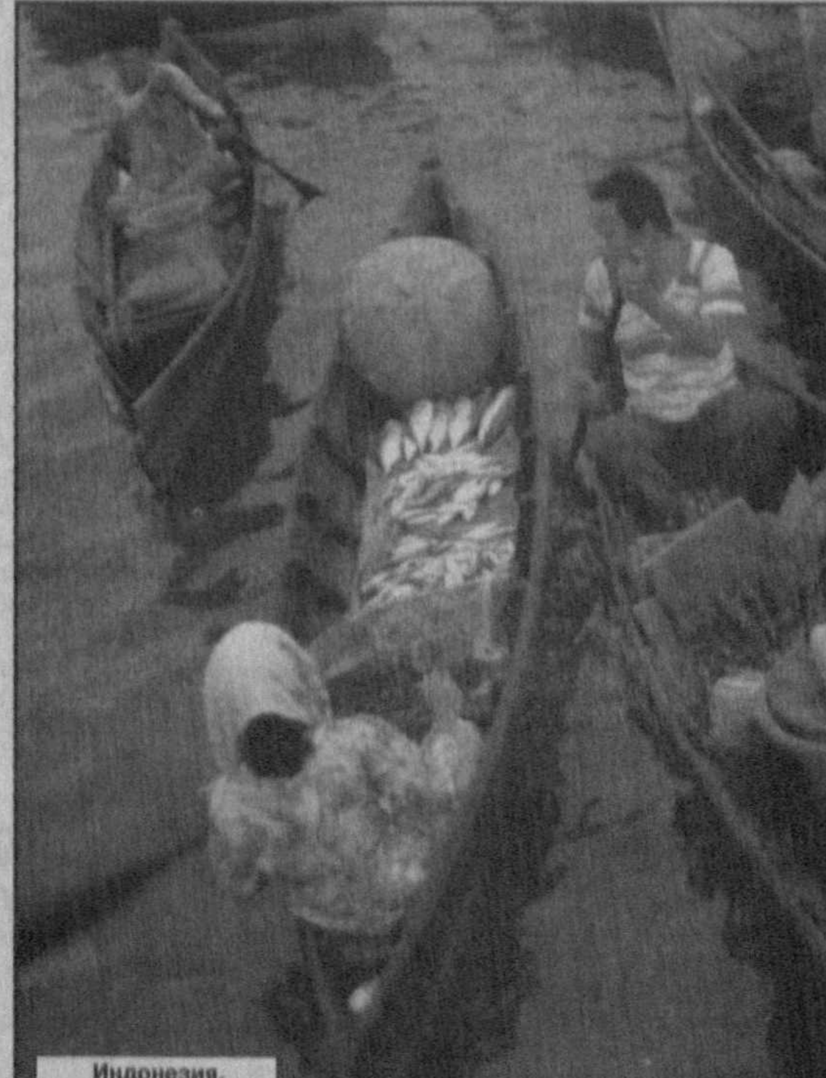
Индонезия. Базар на реке