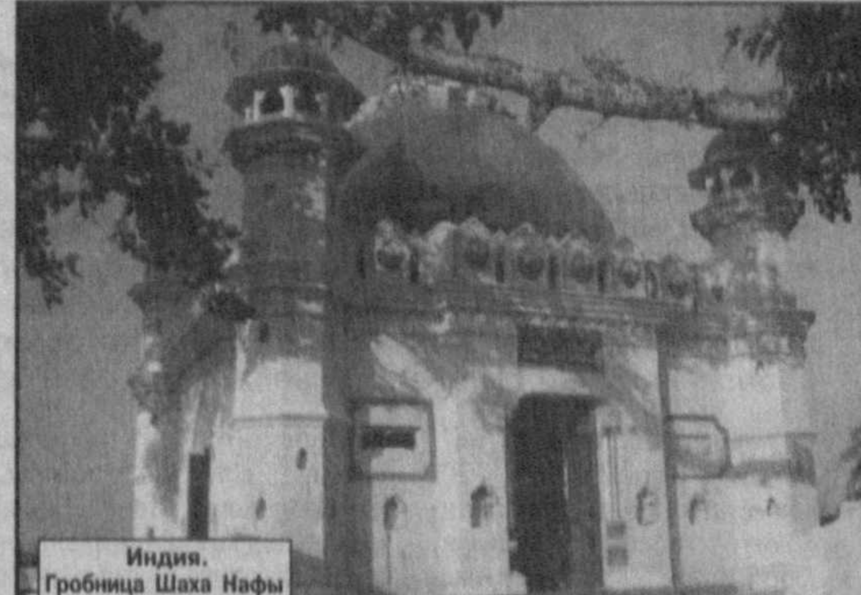
Индия. Гробница Шаха Нафы

Перед поездкой в Мадрид жизненно важно выучить два-три десятка слов на языке Сервантеса. Иначе можно легко попасть враскач — надписи на английском крайне редко встречаются на улицах испанской столицы, не говоря уже о ресторанных меню. Турист на месте не сидит, ему нужно перемещаться по городу. В Мадриде прекрасное метро, однако ни одна из его 201 станции не может похвастаться указателями на английском языке, который считается общепринятым для любителей путешествий. Казалось бы, нет проблем, была бы в руках карта метро. Ан нет, в летние месяцы сразу на нескольких линиях ведутся ремонтные работы. На ремонтируемых участках пущены специальные автобусы и повсюду висят объявления об их существовании, но опять же на испанском.