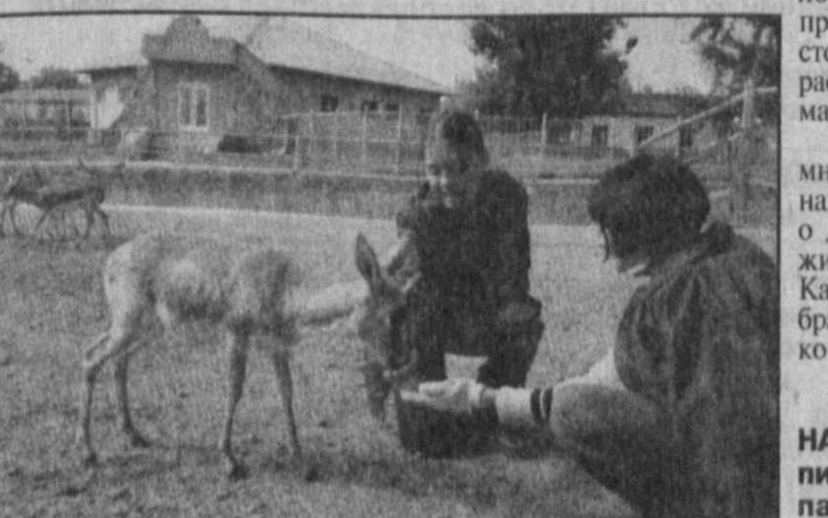
Петр БАРАБАШ, наш общ. корр. НА СНИМКЕ: юные экологи с питомцами Ташкентского зоопарка.

Целый день провели ребята в зоопарке. Они смогли побывать в научных лабораториях, познакомиться с людьми, которые ухаживают за животными. А вопросов у них, как водится, было много. Интересно ребят, в каких условиях живут питомцы зверинца, какая, быть может, им требуется помощь.