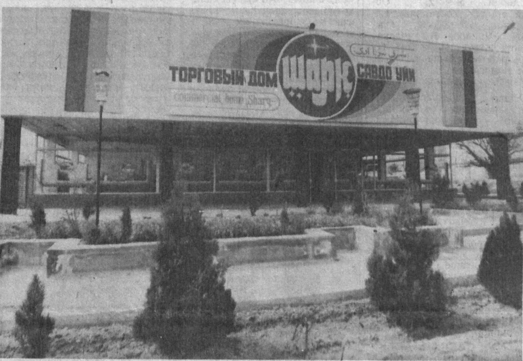
Исторически сложилось так, что на Востоке всегда из всех основных видов деятельности человека, приоритет оставался за торговлей. Ковры, шелк, пряности, кожи, хлопок... Торговые пути раскопались и пересекались в нашем крае. Как известно, где развит торговля, там на первом месте благо-