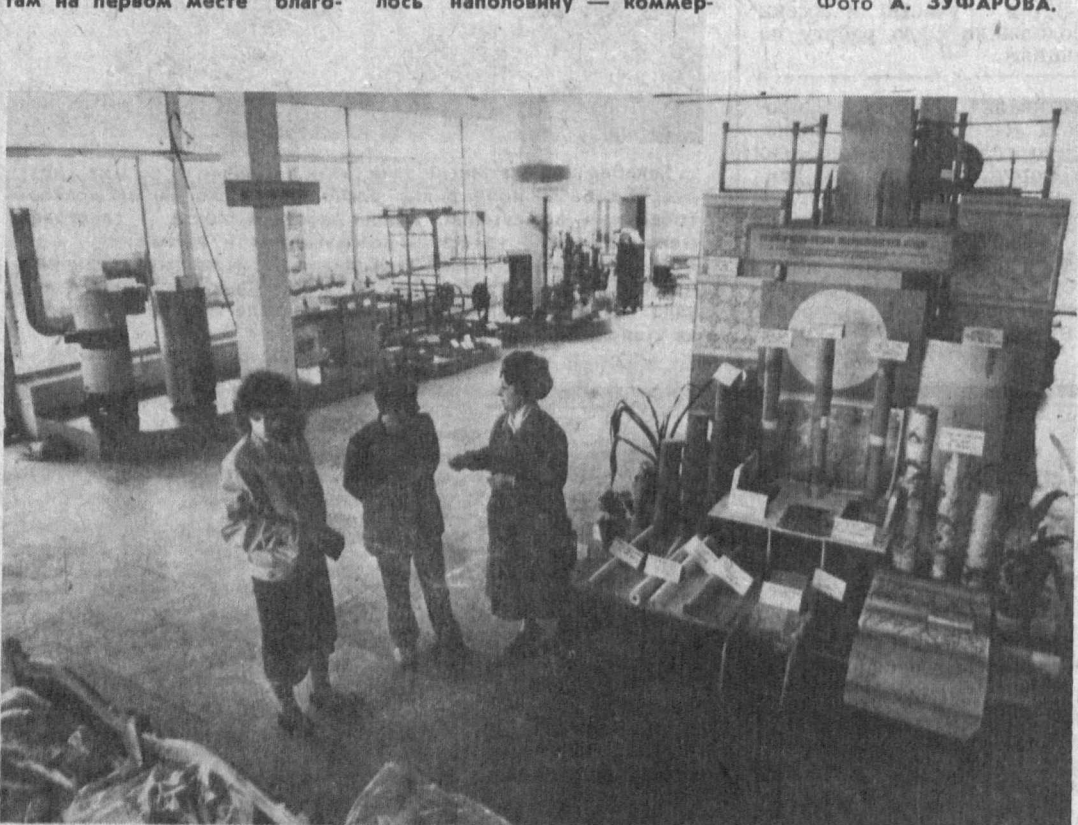
НА СНИМКАХ: общий вид торгового дома «Шарик»; торговый зал.