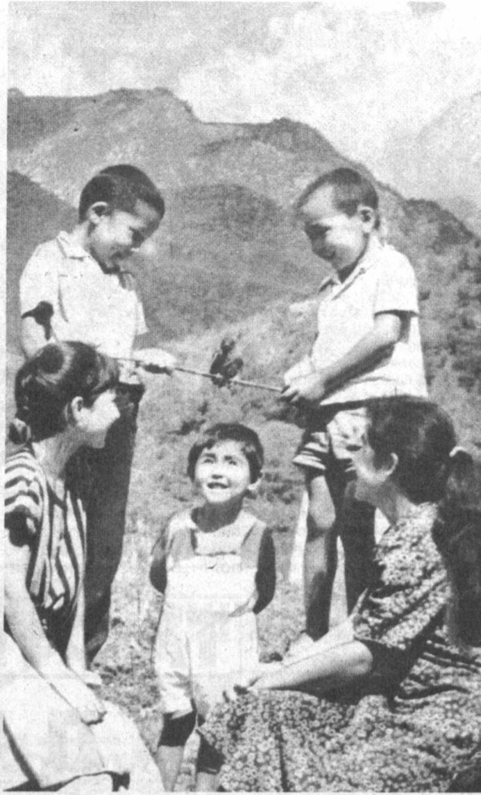
Ёзнинг гашти ўзгача.