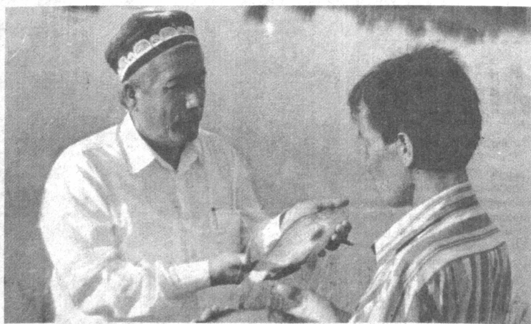
Балиқчиликни ривожлантириш кони фойда эканлигини «Андижонбалиқ» ҳиссасдорлик жамияти фаолиятида кўриш мумкин. Бу ерда йилга 1000 тоннадан балиқ етиштирилади.

Республика биржа марказида акциядорлик жамиятларини қайта ташкил этиш ва уларни қайта шакллантиришда Германия депозитарийсининг тажрибасига бағишланган семинар-кенгаш бўлиб ўтди.