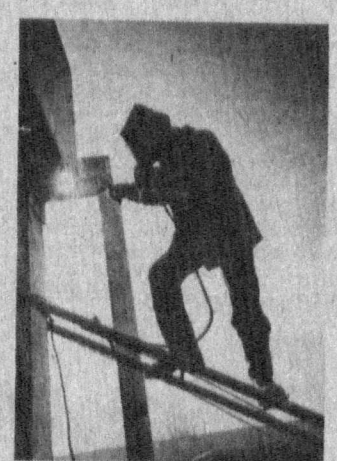
На 7-м квартале массива Юнусовид ведется строительство двух девятиэтажных экспериментальных жилых домов улучшенной планировки. Первый из них предполагается сдать уже нынешней осенью. На втором (на снимке) — работы идут в две смены. Сейчас ведется монтаж нулевого цикла.

Но самое интересное то, что и обратиться-то со своим «восхищением» не к кому. Выходные данные отсутствуют. За исключением: набрано в типографии ТашГосМИ, отпечатано в типографии № 1 ТИПО имени Гафура Гуляма. Полностью составители не знали, что творят, но знали, сколько получат. Ибо справочник стоит 140 рублей!