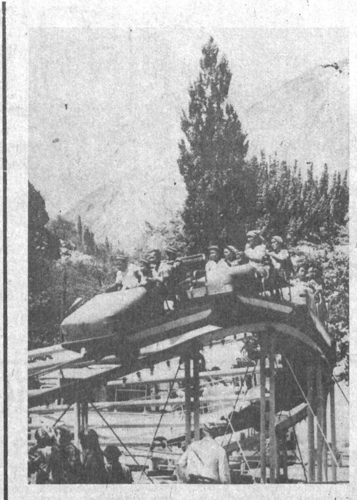
ЛЕТНИЙ ОТДЫХ — В ПАРКЕ