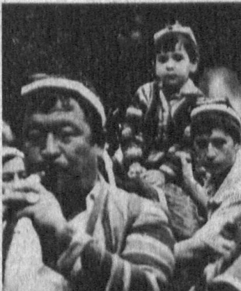
ТРАДИЦИИ ЖИВЫ ПОКА ИХ ЧТУТ

«Суннат-туй» — традиционный праздник в Узбекистане. И проводится он не менее торжественно и весело, чем, к примеру, свадьбы. Вот потому прошедший в воскресенье в Ташкентском районе «Суннат-туй» запомнится его участникам надолго.