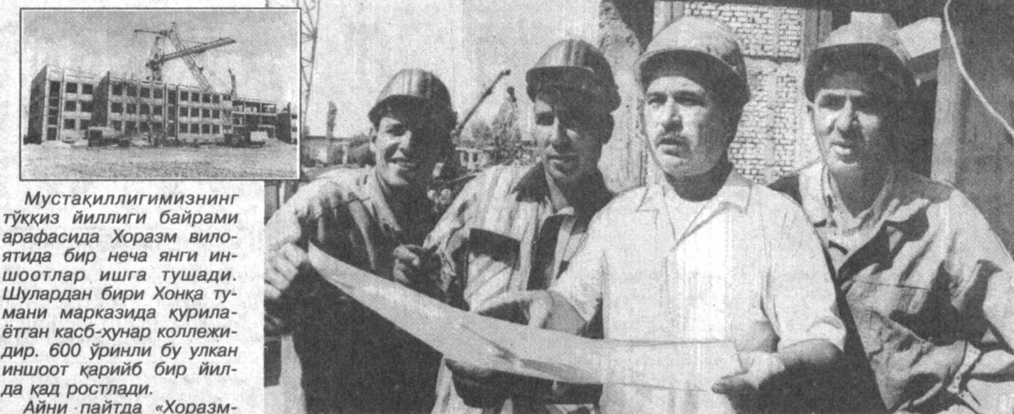
Мустақиллигимизнинг тўққиз йиллиги байрами арафасида Хоразм вилоятида бир неча янги ишоотлар ишга тушади. Шулардан бири Хонқа тумани марказида қурилаётган касб-хунар коллежидир. 600 ўринли бу улкан ишоот қарийб бир йилда қад ростлади.

Судларни ихтисослаштириш масаласи Ўзбекистон Республикаси Олий судининг пленумида муҳокама этилиши муносабати билан 20 дан ортиқ ривожланган давлатларнинг суд тизимидаги ихтисослаштириш жараёнлари