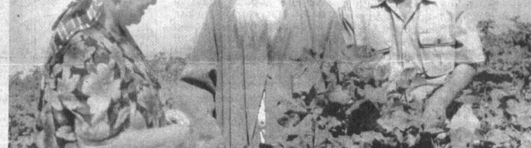
ОЛТИНДАН ҚИММАН МАСЛАҲАТ