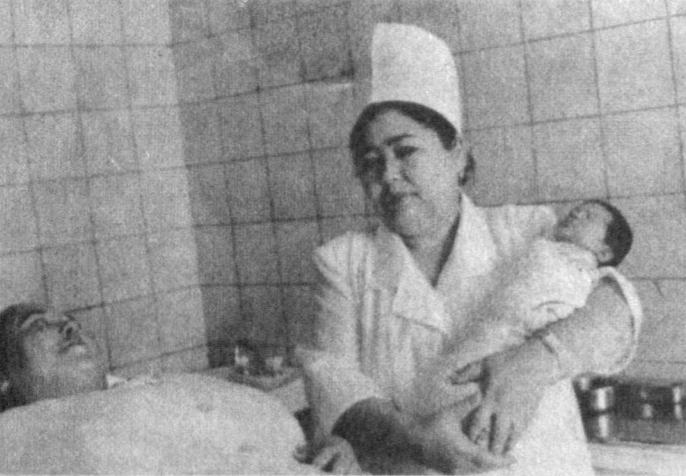
Нукус шаҳрида республика оналик ва болаликни муҳофаза қилиш маркази негизда акушерлик ва гинекология илмий-тадқиқот институтининг филиали фаолият кўрсата бошлади.