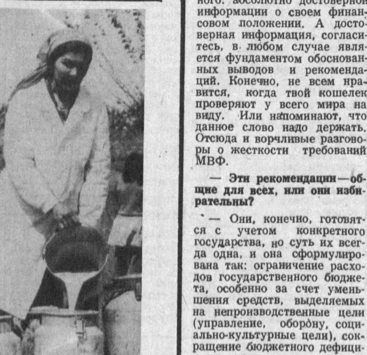
на строительство мини-цеха по переработке животноводческой продукции, придорожной столовой. И. АХМЕДОВ, наш корр. Самаркандская область. НА СНИМКАХ: только что проведен первый укос люцерны на своем кормовом поле в 9 гектаров.