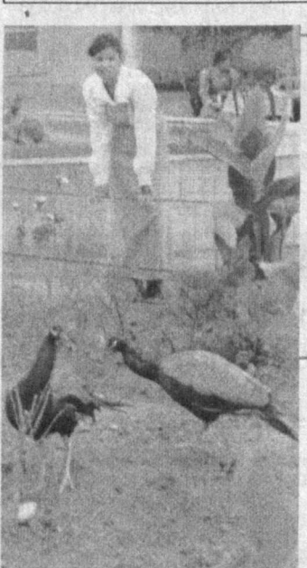
Термизда бошқа шаҳарларда учрамайилган «Болажон» боғи бор. Ном шундай аталса-да, лекин бу катталарнинг ҳам баҳри дили очиладиган маскан. Боғда турли хушманзара дарахтлар билан бирга йиғирма хилдан ортиқ ноёб қушлар ҳам парвартиш қилинади. Шу боисдан шаҳар меҳмонлари ҳам бу боғни зиёрат айлашни қанда қилишмайди. Ва албатта, бу гузал масканнинг ташкилотчиси Хурсан Каримовга ўз миннатдорчиликлари ни изҳор этишади.

Устав капитал 40,2 миллион сўм миқдорига белгиланган ва унинг 82,1 фоизи жисмоний шахсларнинг маблағлари ҳисобига тарқиб топган янги банкнинг очилиши мамлакат Президентининг «Хусусий акциядорлик тижорат банклари тузилиши рағбатлантириш чора-тадбирлари тўғрисида» ва «Ак-