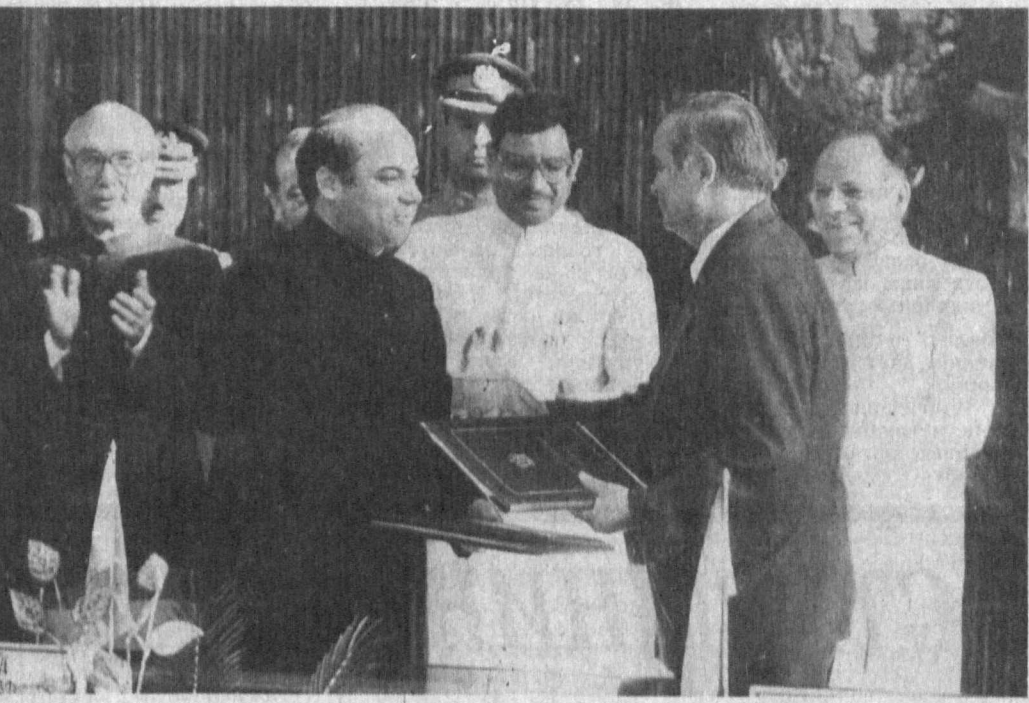
НА СНИМКЕ: во время подписания официальных документов о сотрудничестве.