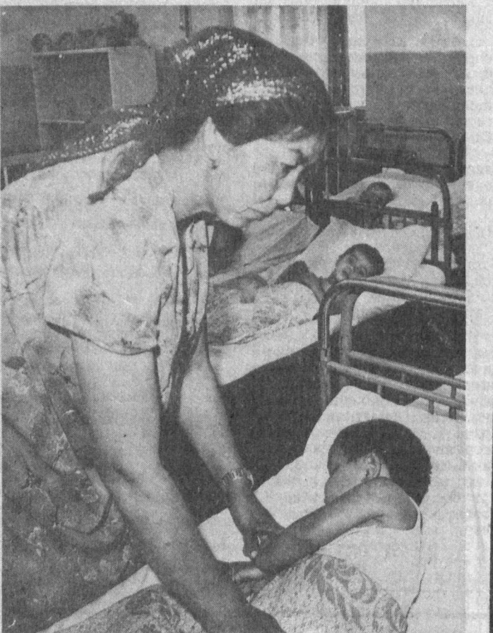
В поселке Диумабазар Южоричирчкского района есть детский сад с нежным названием «Пола» («Тюльпан»). Здесь работает немало опытных, высококвалифицированных воспитателей, которые прилагают все усилия к тому, чтобы дети гармонично развивались, росли здоровыми.

ПО ВЕРТИКАЛИ: 1. Болоньези, 2. Фараби, 3. Лапкин, 4. Биосфера, 6. Ваер, 7. Бату, 9. Кулиева, 10. Абдуллаев, 15. Бураграф, 16. Буглеров, 18. Висота, 19. Арифов, 20. Грош, 21. Ворс.