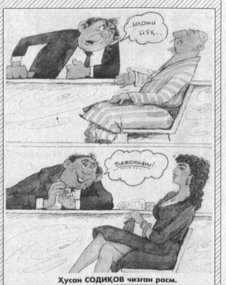
Хусан СОДИҚОВ чизган расм.

Суҳбатдан: — Хотиним билан ҳар уришганда 100 сўм ташлаб қўядиган одатим бор. — Ҳўш, натижа қандай? — Яқинда «Нексия» сотиб олдим. Икки киши гурунглашяпти: — Хар киши жанжал қилаверадиган кишини қўшинлари кўчириб юбориши мумкинми? — Нима, сиз ўша жанжалқашини қўшинимисиз? — Йўқ, мен ўша жанжалқашининг ўзиман.