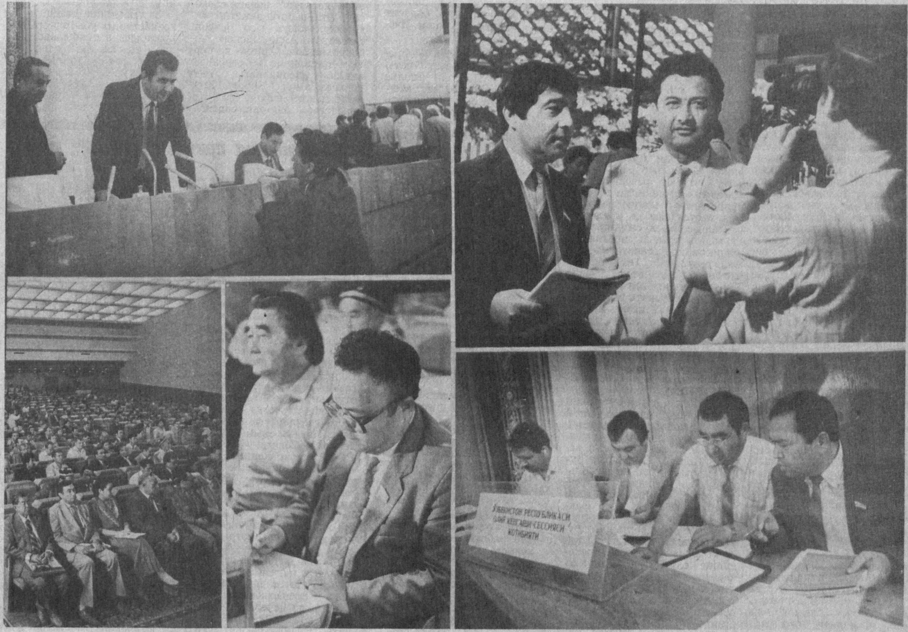
НА СНИМКАХ: так работала сессия.