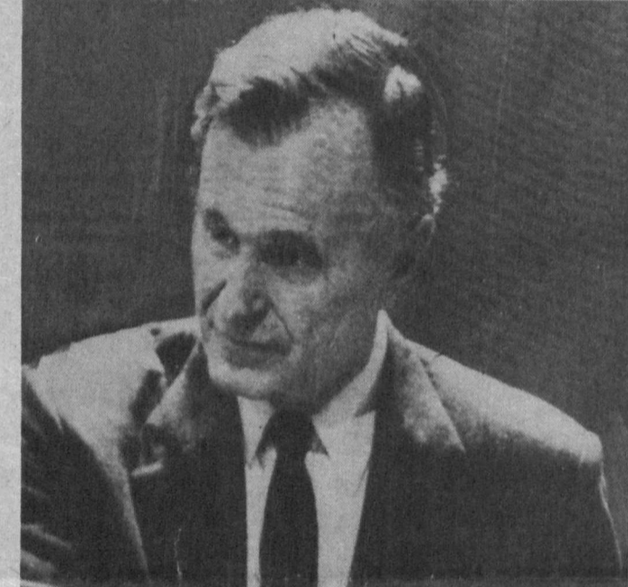
ДЖОРДЖ БУШ: родился в 1924 году. Специальность — экономист. С 20 января 1989 года — президент Соединенных Штатов Америки. Джордж Буш встретился с Президентом Республики Узбекистан Исламом Абдуганиевичем Каримовым.

— Уважаемый Ислам-ана, благодарю Вас за содержательную беседу. Желая Вам новых успехов.