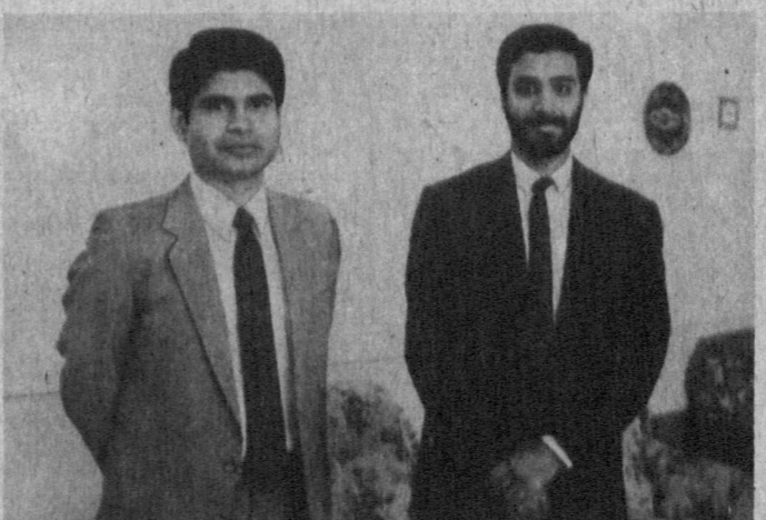
Удивительно, что так близки даже знаменательные даты в истории двух народов. Впрочем, не только даты, прежде всего близки их сердца... Т. ДОЛИЕВ.

Долго длилась беседа с индийскими друзьями — об экономике, об искусстве кино, о праздновании независимости двух народов. Индия будет праздновать День независимости 15 августа, а Узбекистан первую годовщину своей независимости отметит 1 сентября.