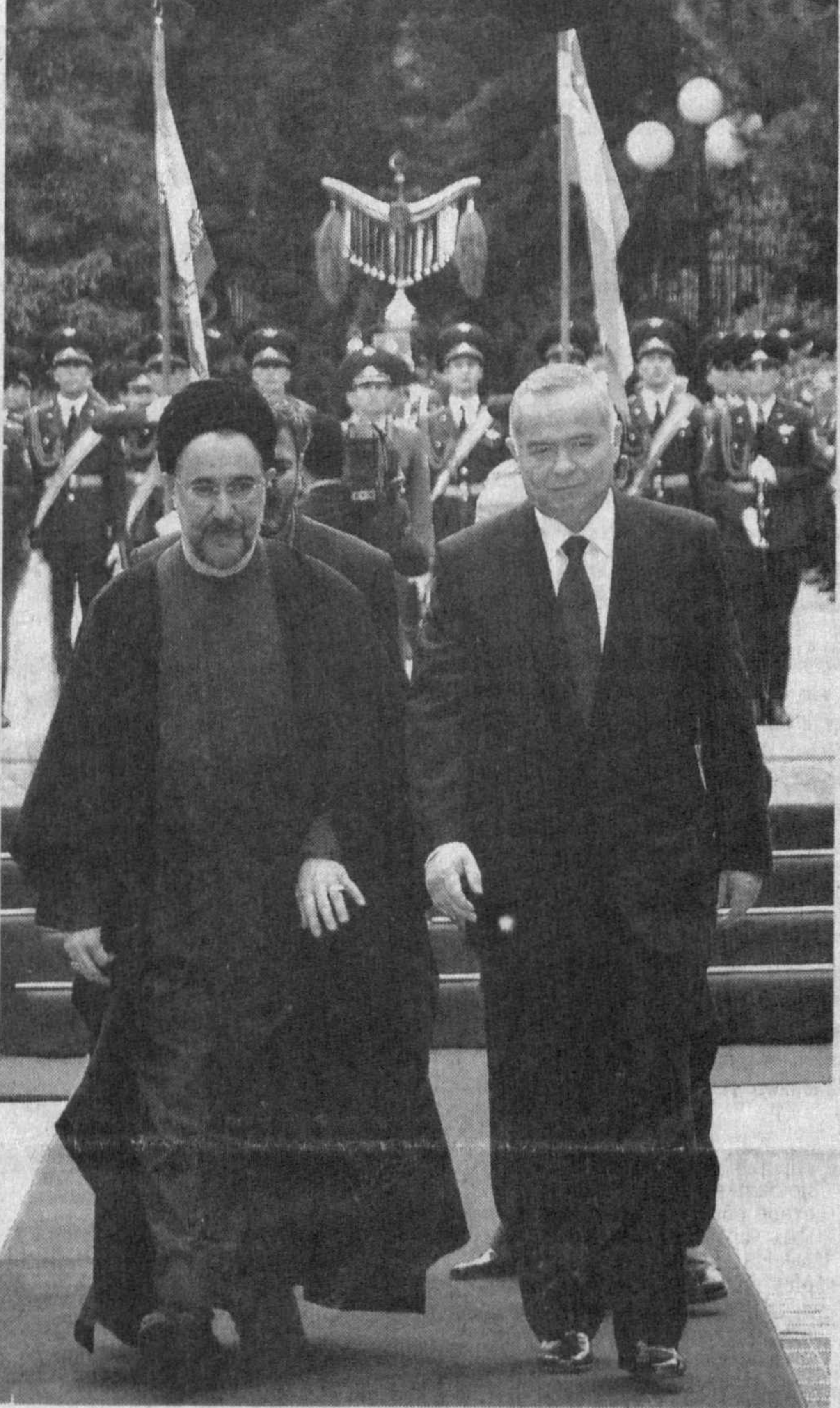
Президент Ислам Каримов и Президент Исламской Республики Иран Мухаммад Хатами.

В ходе визита Президент Ирана встретился с учеными-востоковедами Академии наук Узбекистана. На встрече речь пойдет на тему «Диалог цивилизаций и развитие Востока». Также он посетит города Самарканд и Бухару.