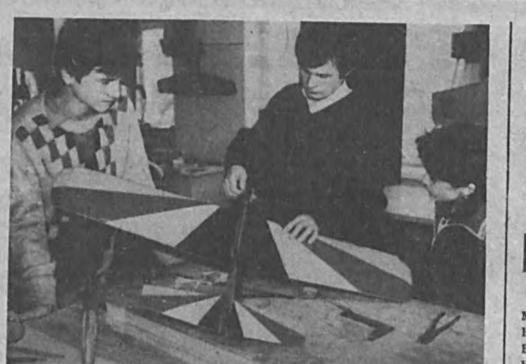
НА СНИМКЕ: юные анимомоделисты готовятся к соревнованию.