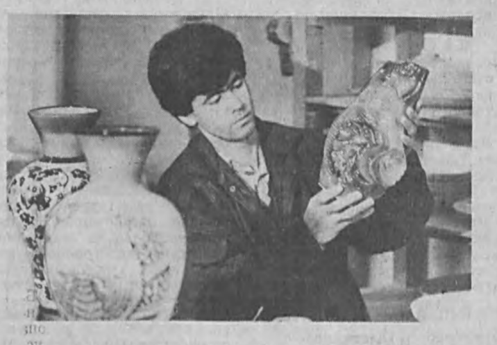
Шерабадский завод гончарных изделий производит более 30 видов продукции.

Труженники Иштыхана торжественно отметили 50-летие со времени образования своего района. На праздник приехали гости из Ташкента, соседних областей. Накануне праздника открылся Музей истории района. Слано в эксплуатацию трехэтажное здание поликлиники. Во многих кишлаках впервые загорелось «голубое топливо». В парке культуры и отдыха имени Мура-