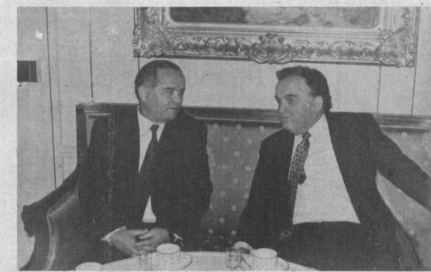
Встреча Президента страны Ислама Каримова с Президентом Швейцарской конфедерации Отто Штихом.

21 января важного указа, касающегося развития, предпринимательства и усиления защиты частной собственности, здесь, в далекой Швейцарии, узнали еще до приезда нашего Президента. Хотя форум в Давосе обычно посвящается экономическим проблемам, туда съехало очень много политиков. Наш Президент встретился и имел беседы здесь с Президентом Турции Сулейманом Демирелем, Президентом Казахстана Нурсултаном Назарбаевым, Президентом Туркменистана Сапармурадом Туркменбаши, премьер-министром Пакистана Беназир Бхутто, премьер-министром России Виктором Черномырдиным, министром иностранных дел Израиля Шимоном Пересом. Кроме того, в ходе Давосского форума Ислам Каримов в своей резиденции принял руководителей крупнейших в мире банков и фирм. Среди них были Николай Сенн — председатель правления Юнион банк оф Свинтерленд (ЮВС), его заместитель Карл Янзола, руководитель Европейского банка реконструкции и развития Жак де Ларозьер и его заместитель Рональд Майкл Фриман, владелец ряда крупнейших компаний в Европе Клаус Якобс, коммерческий директор швейцарского телевидения Отто Хонеггер, президент известного банка «Креди Свисс» Райнер Гут и другие. Грудно перечислить всех бизнесменов и банкиров, побывавших в резиденции Президента, не говоря уже о тех людях, которые изъявили желание встретиться с нашим Президентом, но не сумели этого сделать из-за его крайней занятости. Впрочем, обращаясь к ним на пресс-конференции, наш Президент сказал: «Приезжайте