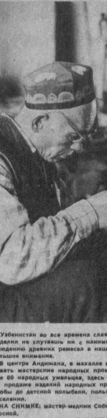
Узбекистан во все времена славился своими мастерами. Их изделия не спутаешь ни с какими другими.