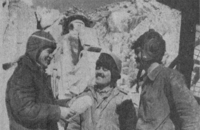
СУРХАНДАРЬИНСКАЯ ОБЛАСТЬ. Соляные месторождения в Хожанкинде...