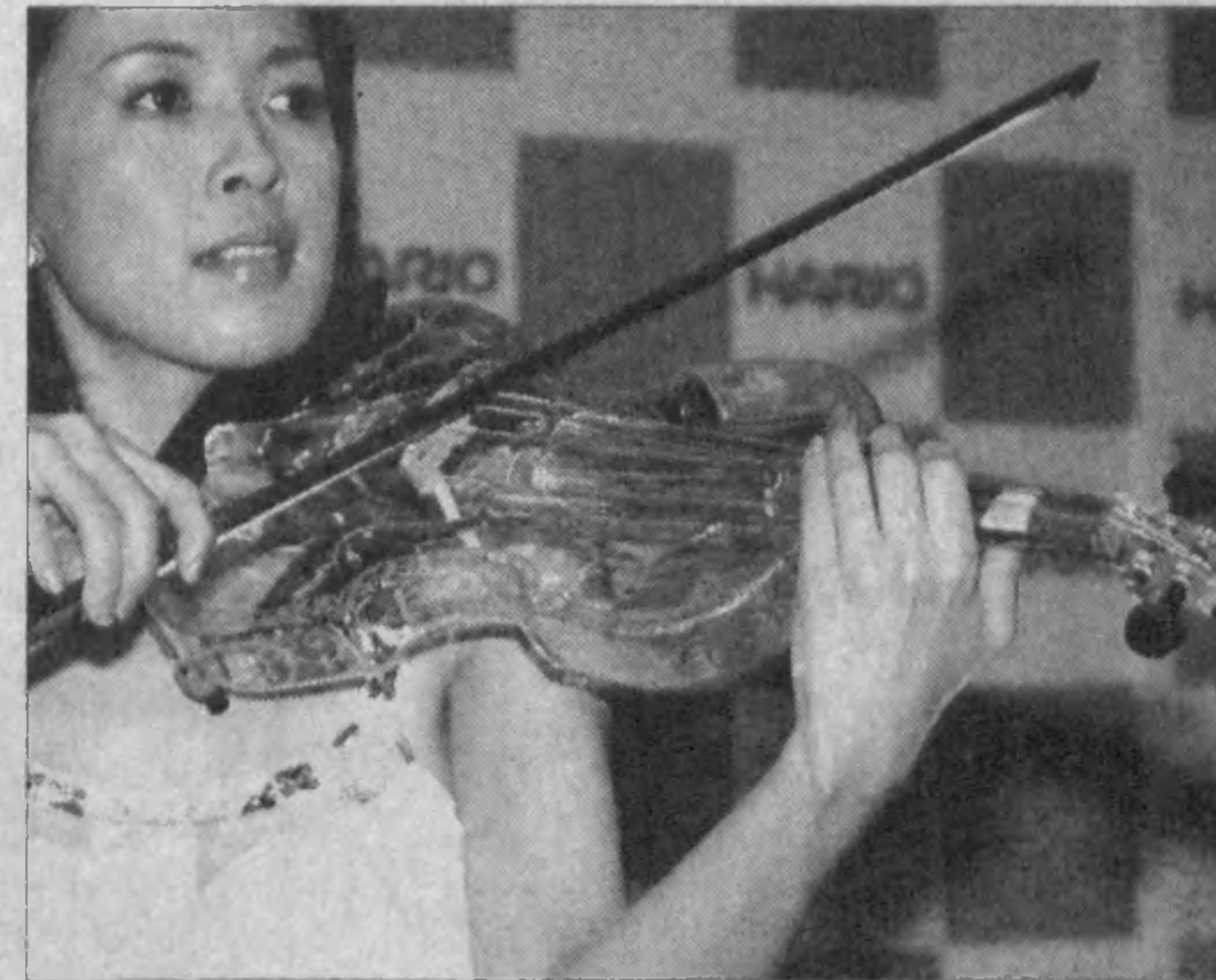
ЯПОНИЯ. Стеклопанная скрипка звучит очень необычно — но красиво. И потому ее производитель желает получить от покупателя инструмента 40 000 евро.

Номинанты 76-й ежегодной церемонии награждения «Оскара» будут объявлены 27 января. Победителей мир узнает 29 февраля 2004 года.