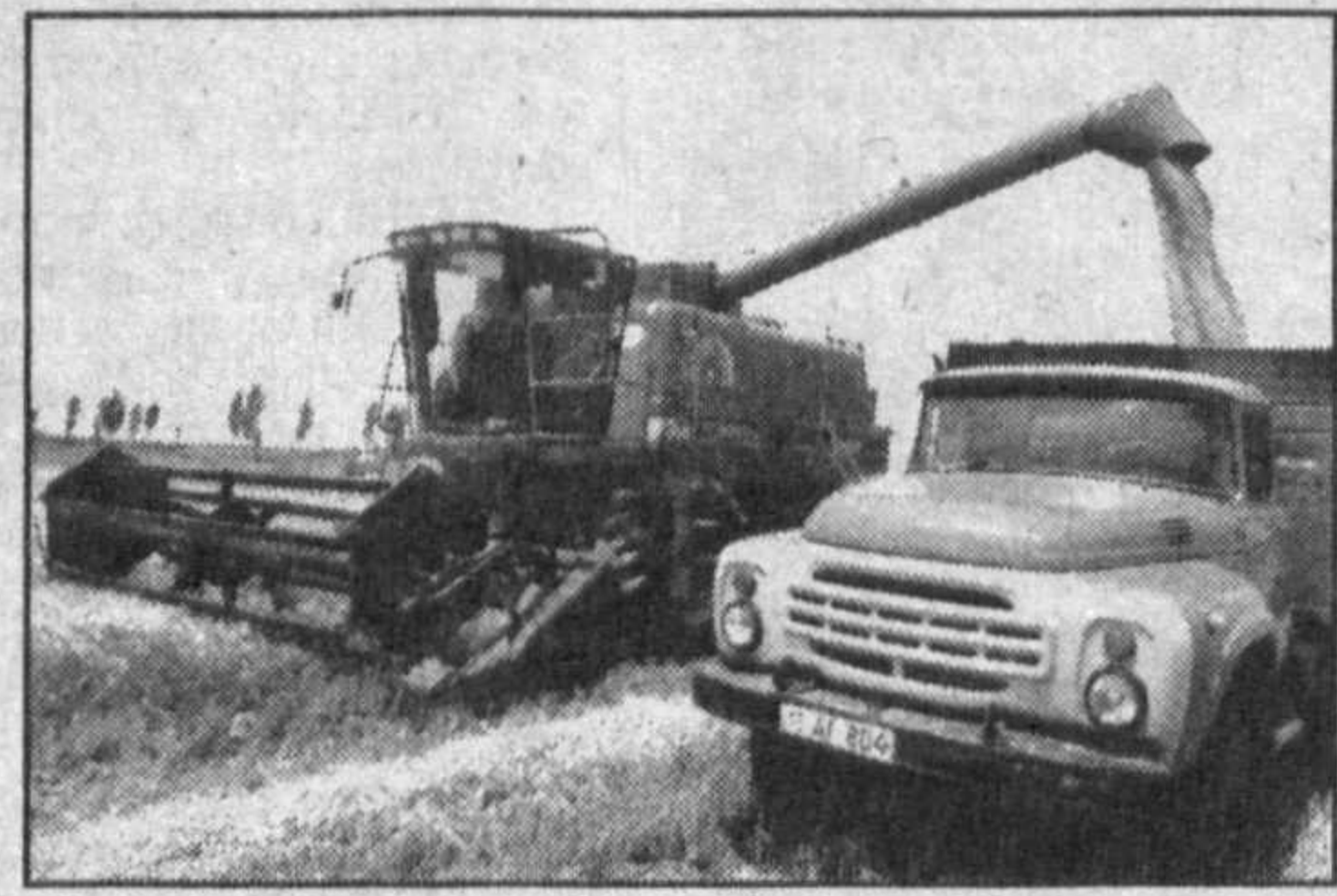
НА СНИМКАХ: арендатор ширкатного хозяйства Кулдаши Фозилов; идет жатва пшеницы. Фото Ш.ОЛИМОВА. Уз.

В нынешнем сезоне мы засеяли площадью 7,7 гектара на участке "Авазбек", — рассказывает арендатор. — С каждого гектара намолотили по 62 центнера зерна. Теперь все усилия направляем на уход за посевами хлопчатника. Его мы возделываем на 32 гектарах. Кстати, сев провели методом подпашного сева на всей этой площади. И получили ранние дружные всходы.