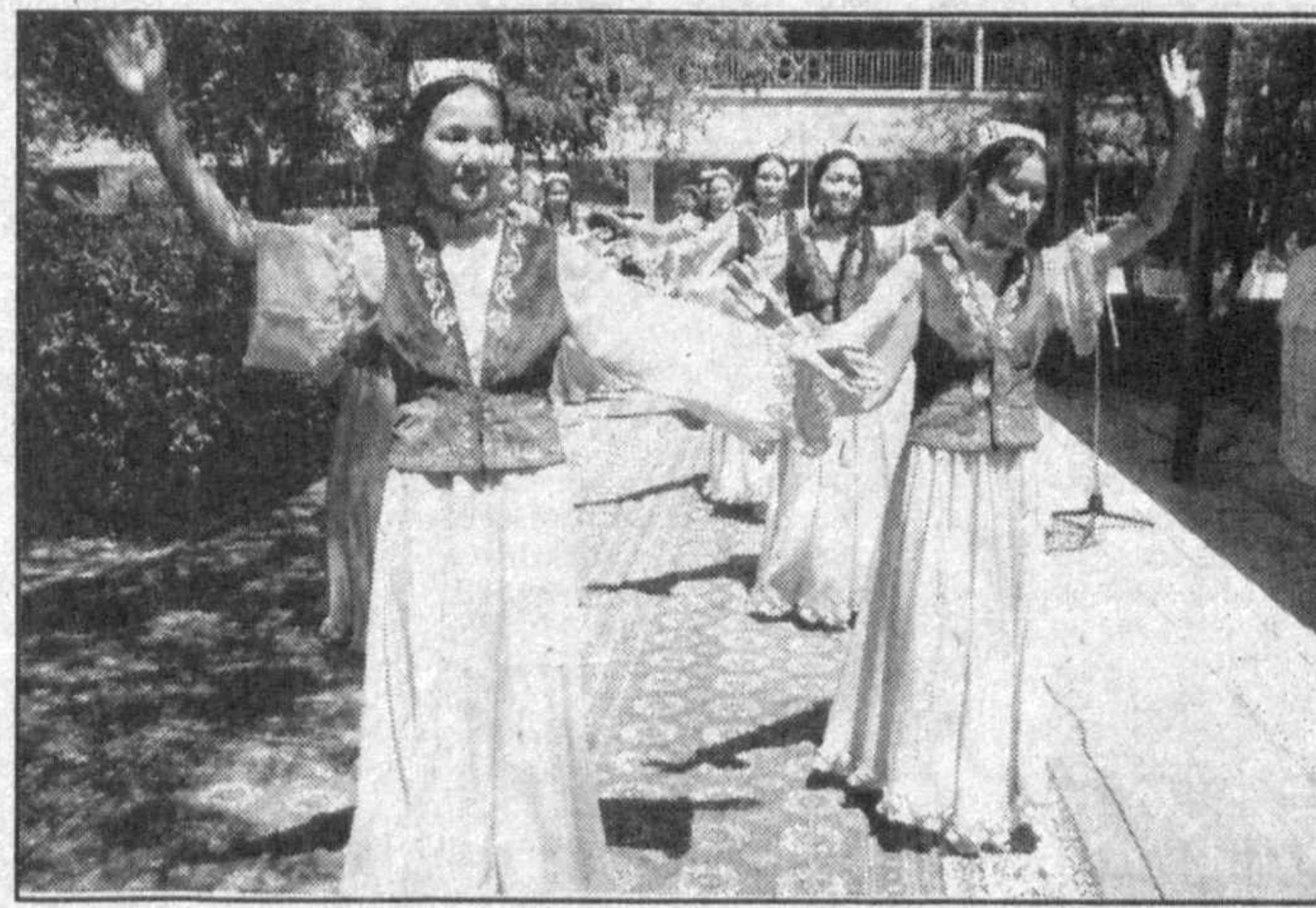
НА СНИМКЕ: выступает творческий коллектив Каракалпакского государственного университета.