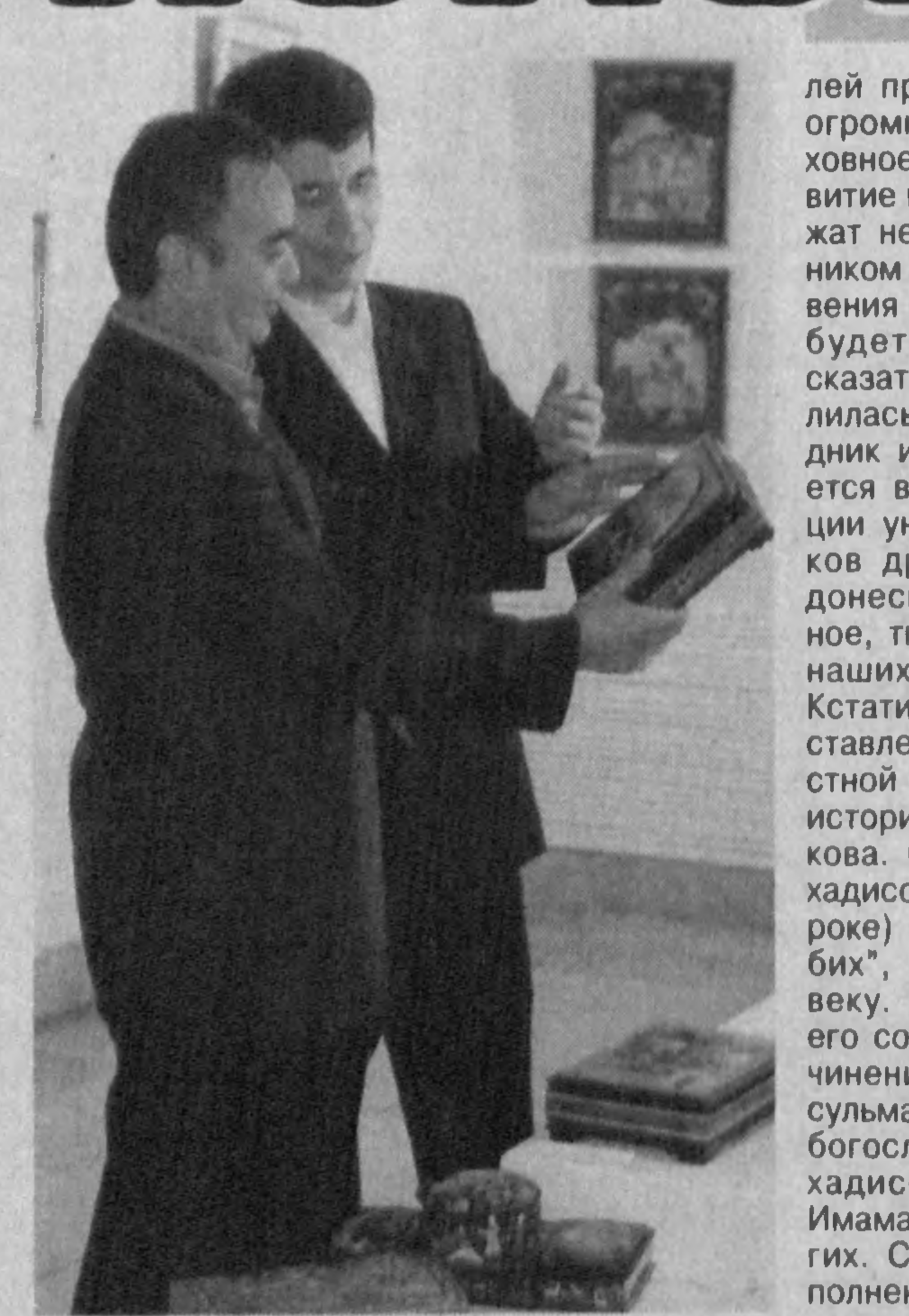
(Окончание. Начало на 1-й стр.)

лей прошлого оказывают огромное влияние на духовное, нравственное развитие нашего народа, служат неиссякаемым источником творческого вдохновения для художников. Не будет преувеличением сказать, что выставка вылилась в настоящий праздник искусства. Открывается выставка с экспозицией уникальных памятников древних рукописей, донесших до нас духовное, творческое наследие наших великих предков. Кстати, на выставке представлены рукописи из частной коллекции ученого-историка Хайдара Бобобекова. Среди них сборник хадисов (преданий о пророке) "Муликот ал мусо-бих", относящийся к XIV веку. Первоисточниками его создания служили сочинения известных в мусульманском мире ученых-богословов, собирателей хадисов Имама Бухари, Имама ат Термизи и других. Страницы книги выполнены из бумаги, кото-