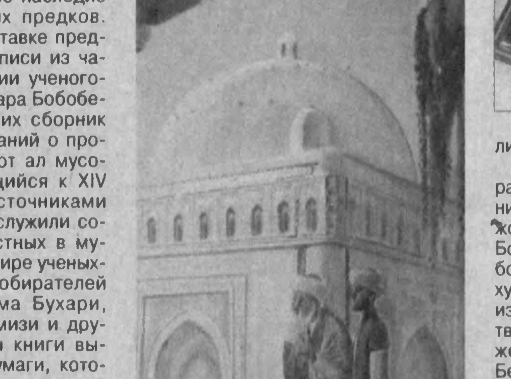
рая предварительно подвергалась специальной обработке, что придавало ей устойчивость к внешним и временным воздействиям.

лей прошлого оказывают огромное влияние на духовное, нравственное развитие нашего народа, служат неиссякаемым источником творческого вдохновения для художников. Не будет преувеличением сказать, что выставка вылилась в настоящий праздник искусства. Открывается выставка с экспозицией уникальных памятников древних рукописей, донесших до нас духовное, творческое наследие наших великих предков. Кстати, на выставке представлены рукописи из частной коллекции ученого-историка Хайдара Бобобекова. Среди них сборник хадисов (преданий о пророке) "Муликот ал мусо-бих", относящийся к XIV веку. Первоисточниками его создания служили сочинения известных в мусульманском мире ученых-богословов, собирателей хадисов Имама Бухари, Имама ат Термизи и других. Страницы книги выполнены из бумаги, кото-