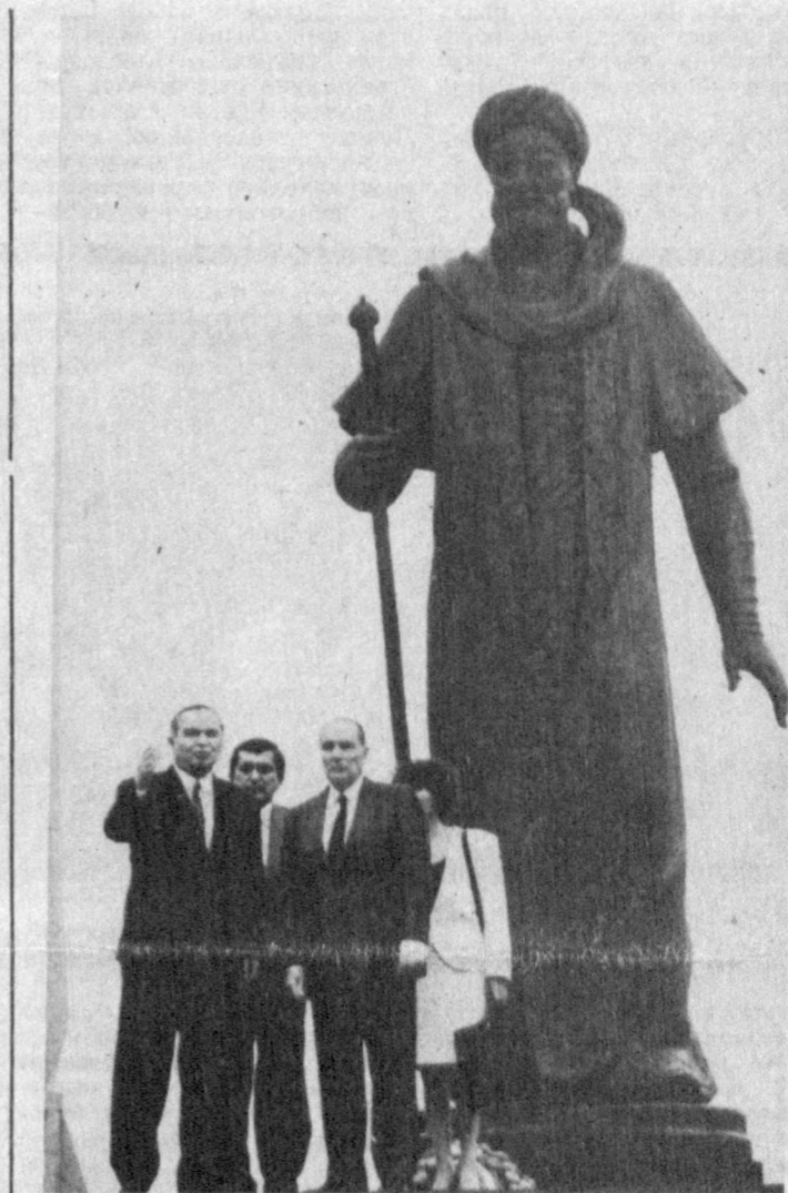
Возложение цветов к памятнику Алишеру Навои.

первым в Центральноазиатском регионе специализированным учебным заведением. Участники встречи — студенты и преподаватели вуза — рассказали почетным гостям о его задачах и перспективах. Было отмечено, что вуз, созданный по указу Президента Узбекистана Ислама Каримова, ориентирован на обучение специалистов для работы за рубежом и призван быть лидером в организации и реформировании высшего образования. Он стал кузницей кадров, овладевающих основами мировой экономики и бизне-