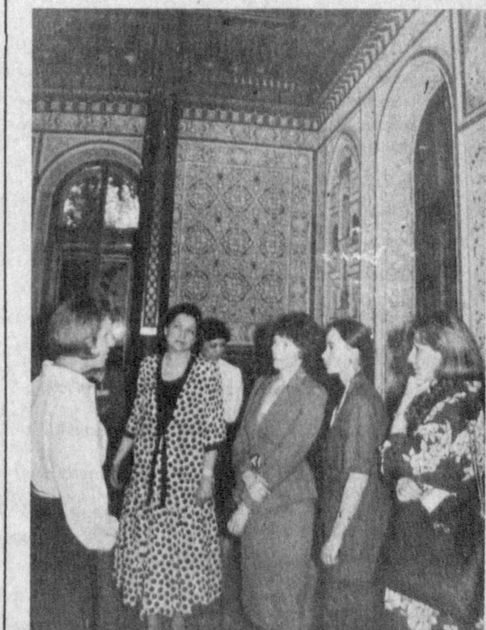
Во время посещения Музея прикладного искусства Узбекистана супругами президентов.