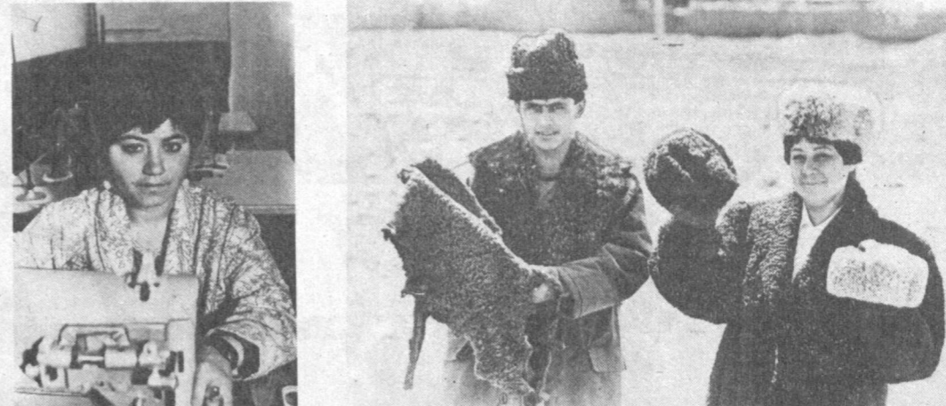
КАШКАДАРЬ И СКАЯ ОБЛАСТЬ. В центральной усадьбе гослесхоза «Пачкамар» Гузарского района начало действовать малое предприятие «Рахин». Здесь