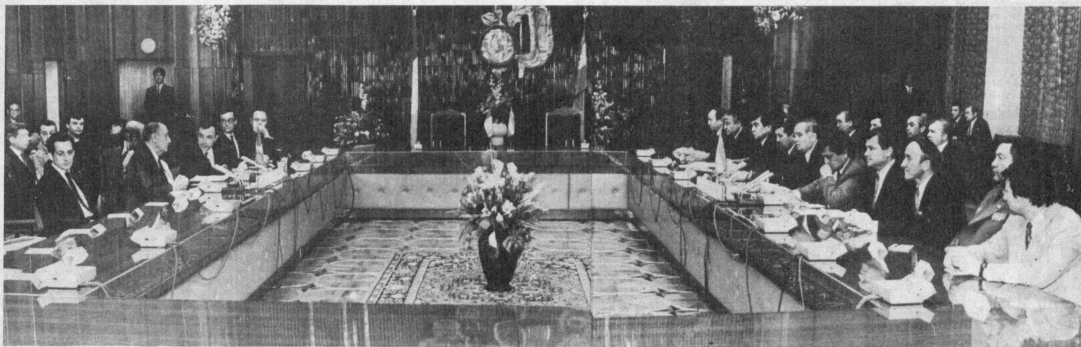
Во время переговоров.