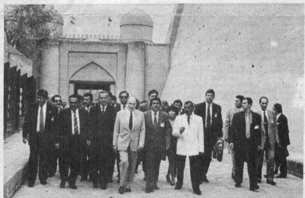
Посещение хорезмской земли.