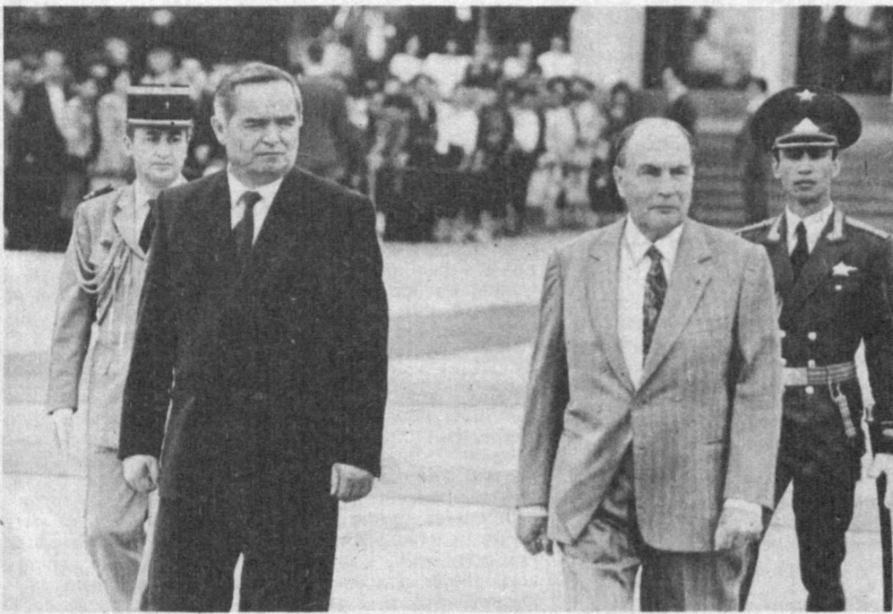
НА СНИМКАХ: во время церемонии проводов в Ташкентском аэропорту.