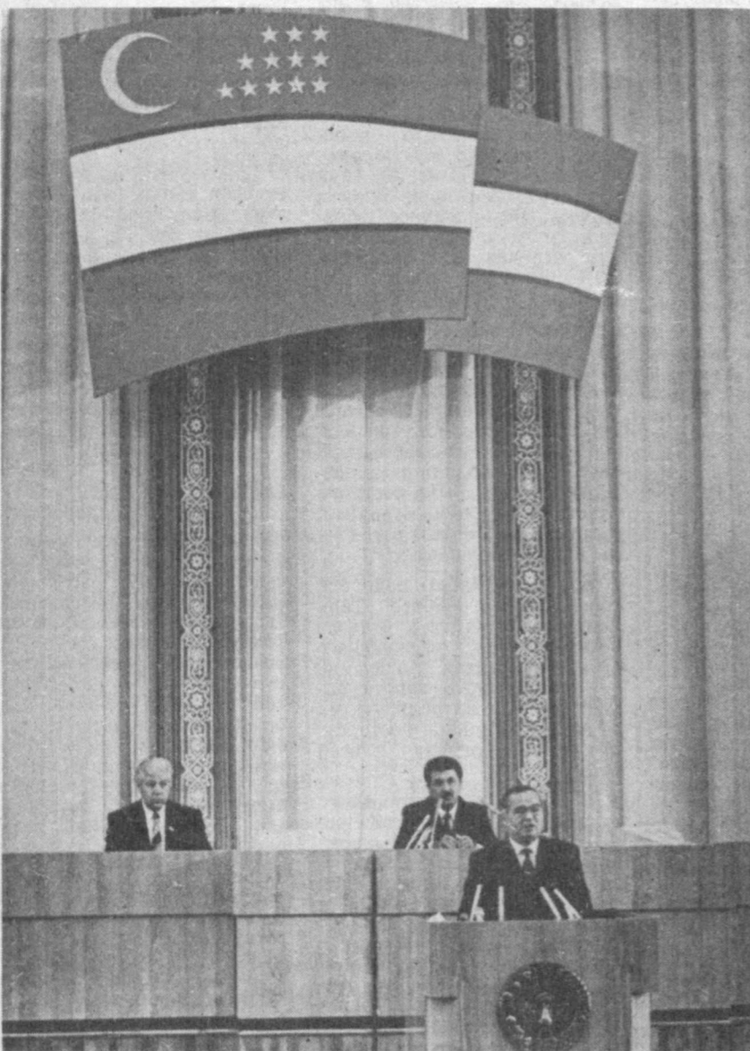
НА СНИМКАХ: во время работы сессии.