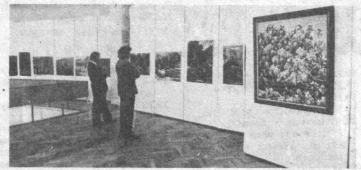
Сразу две экспозиции под названием «Радость весеннего цвета» и «Родниковые краски Востока» расположились под крышей Республиканского интернационального культурного центра, сделавший своеобразный подарок для любителей изобразительного и декоративно-прикладного искусства.