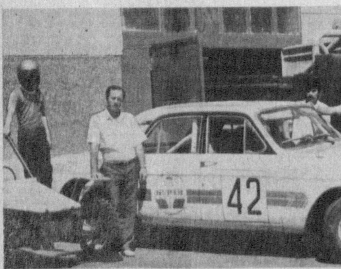
Занимался В. ПОПЛАВСКИЙ.

Автопробег дело и сложное, и дорогостоящее. Естественно, наши нужды поглощают немалые средства, но, как говорится, овчинка стоит выделки. В ряды армии независимого Узбекистана идут от нас новобранцы, вооруженные достаточным опытом вождения автомобилей, крепкими, здоровыми, надежными в дружбе и любых жизненных испытаниях. Иными словами, здесь формируется личность человека.