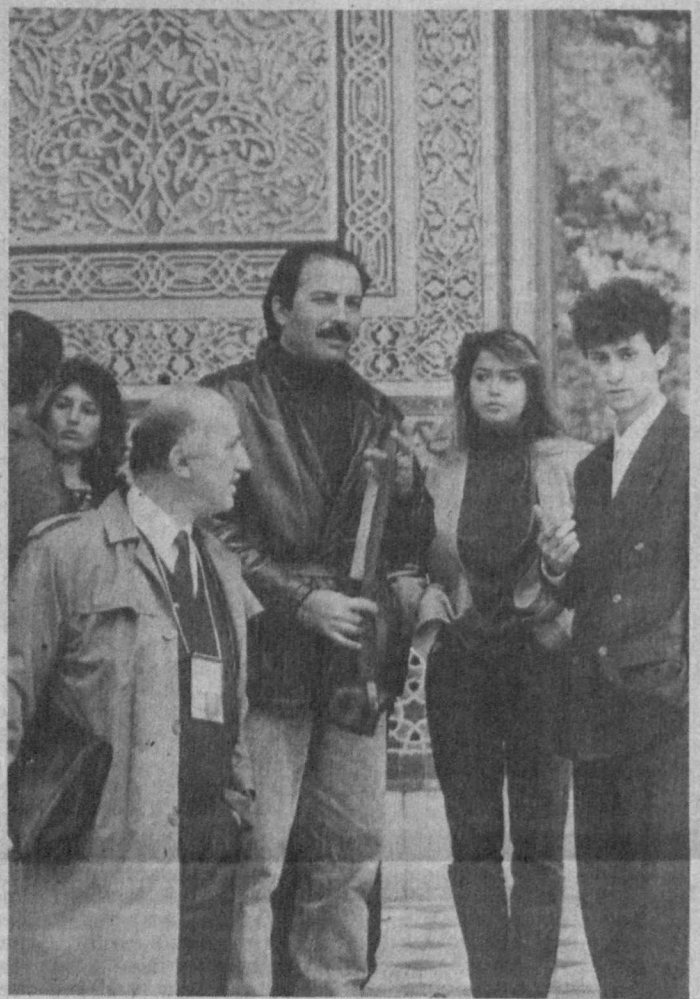
САМАРКАНД. Гости и участники XI Международного кинофестиваля стран Азии, Африки и Латинской Америки посетили древний город Средней Азии — Самарканд. НА СНИМКЕ: во время посещения достопримечательностей Самарканда.

Этот фестиваль главным результатом своей работы будет иметь творческие контакты кинематографистов разных стран. Фестиваль этот — наш первый, самостоятельный. Не хотелось бы называть его первым блином, который комом, потому что бесследно он, безусловно, не пройдет. Но мы пока только набираемся опыта самостоятельности.