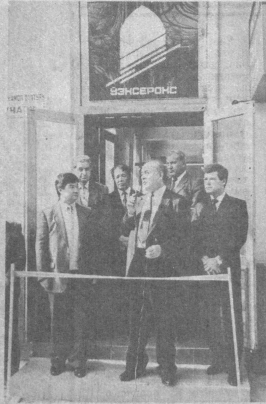
продукция совместного узбекско-британского предприятия «Узбексерокс», презентация которого состоялась 26 октября в Ташкенте.