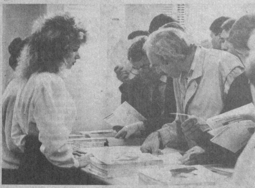
Каждый день в мире изготавливается до 4-х миллиардов копий, причем половина из них — на копировальных машинах «Ксерокс». Некоторые коррективы в эту статистику внесет теперь продукция совместного узбекско-британского предприятия «Узбексерокс», презентация которого состоялась 26 октября в Ташкенте.