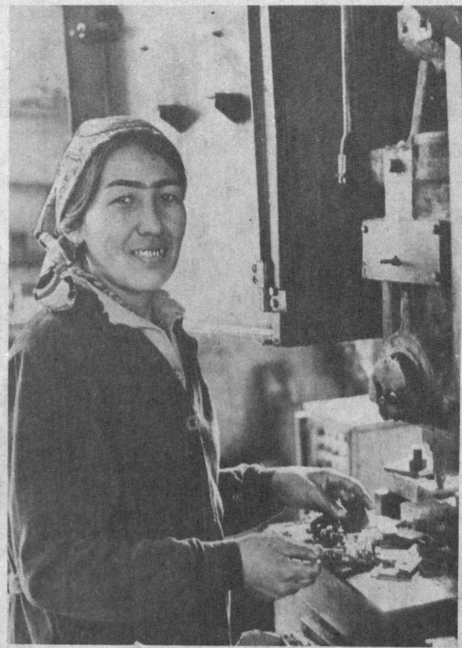
НАМАНГАНСКАЯ ОБЛАСТЬ. Уйчиское опытно-экспериментальное предприятие по производству товаров народного потребления совместно с Ферганским заводом газовой аппаратуры начали выпуск газовых плит. С начала года уже выпущено около двух тысяч газовых плит.

В этот раз мне было очень приятно. Я почувствовал, что Шараф Рашидович, находясь в рабочей поездке в Хорезме, приехал на несколько часов в Ташкент, чтобы встретить иностранную делегацию. Он попросил разыскать документы о праздновании юбилея института и, подписав их, уехал. По прошествии времени мое предположение подтвердилось другим событием: по получении институтом ордена в Верховный Совет бывшего Союза была отпущена благодарность. Почти сразу же по телефону был получен ответ. Представление к награде — один из последних документов, подписанных Ш. Рашидовым. Как известно, из последней поездки он не вернулся.