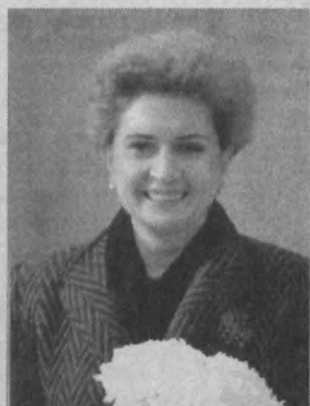
Потому и остаюсь верной "Ахбороту" столь длительное время.

— Только такой ритм подачи новостей зрителю меня устраивает. Наверное, можно даже сказать, что это мой ритм, в котором и работать, и жить, уверена, интереснее.