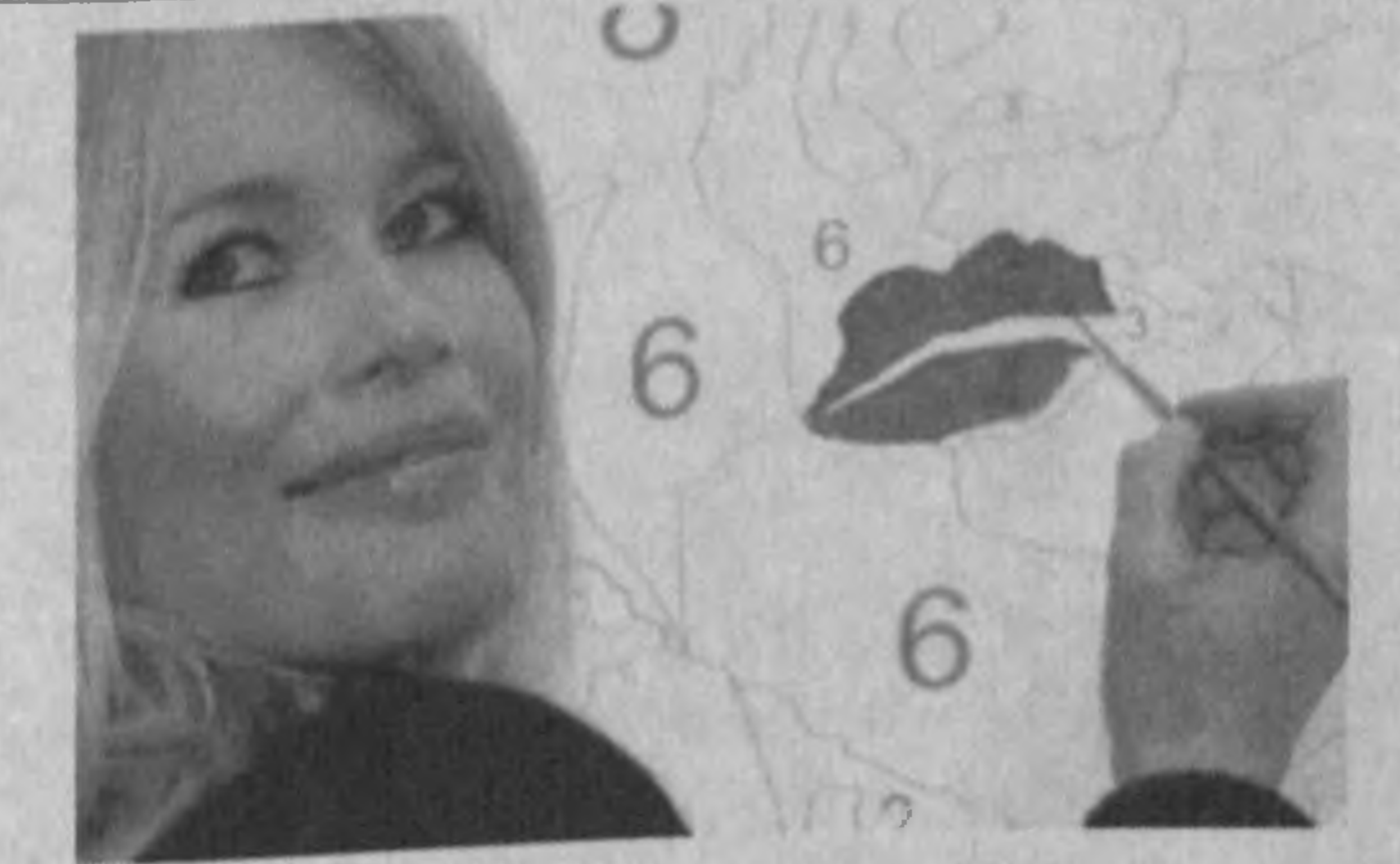
Клаудия Шиффер перерисовывает фрагмент картины Модильяни "Портрет девушки" в Ковент-гардене, Лондон.

Подготовлено по материалам зарубежных СМИ.