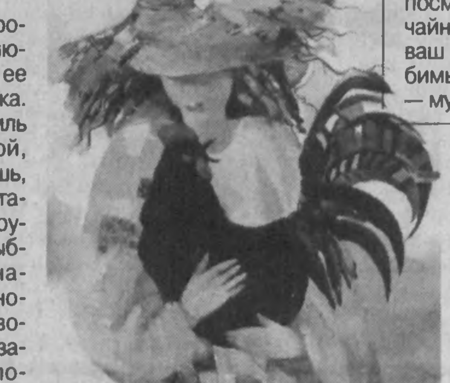
мадам", но наверняка в будущем не изменит семейной стезе. Ведь атмосфера, окружающая девочку с детства, в буквальном смысле разноцветная и жизнеутверждающая. А это лучший способ познания самого великого чувства на земле — любви.