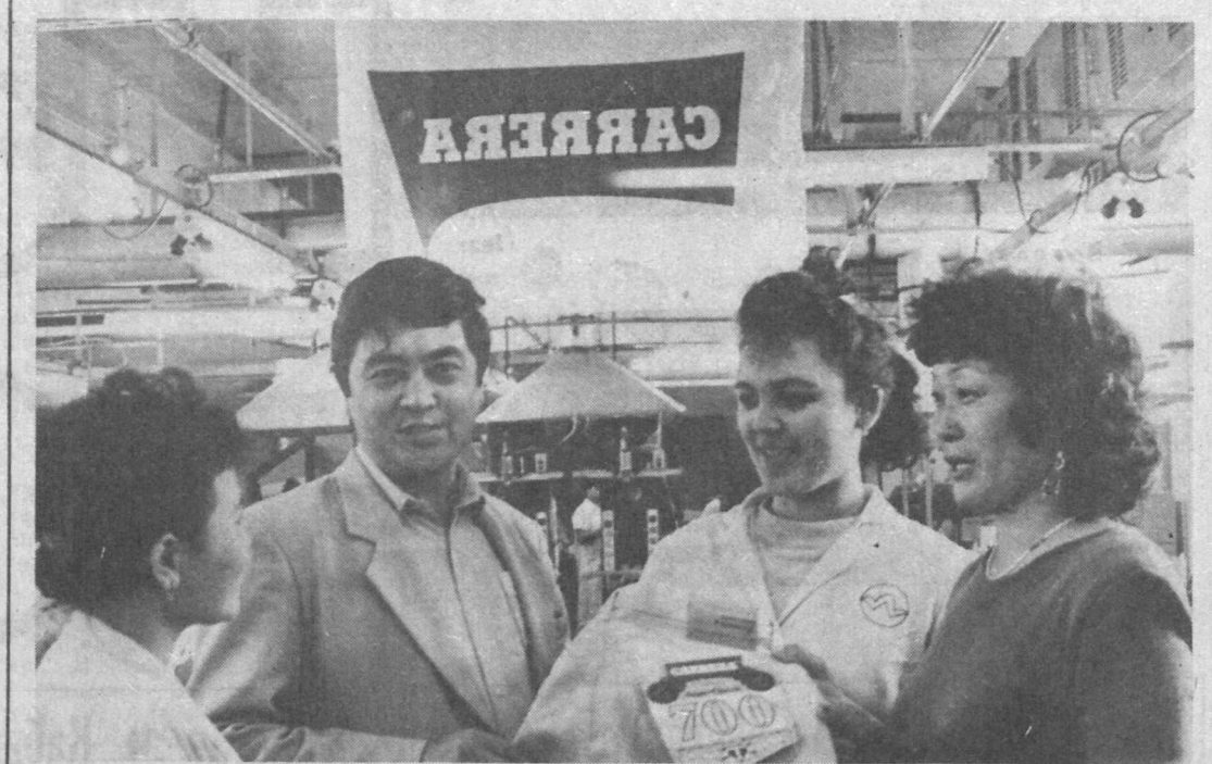
Кому не по душе модная, элитная, а, главное, качественная импортная одежда? Но сегодня купить ее не каждому по карману. Однако не стоит расстраиваться. В скором времени наша молодежь будет щеголять в джинсах фирмы «Каррера».

Ученые Казахстана изучили опыт массовой организации фермерства на базе кооператива «Коминтерн» Талды-Курганской области. Здесь организовано 86 фермерских хозяйств. Сошлюсь для примера на данные анализа деятельности двух фермеров. Каждый имеет по 120—180 гектаров пашни, 20—30 гектаров пастбищ, по два трактора, грузовую машину, по 140—180 голов овец. В семье каждого 3—4 работника (сыновья, дочери). Всю произведенную продукцию реализуют по договору бывшему совхозу. Как владельцы земли, техники, скота фермеры работают на полную от-