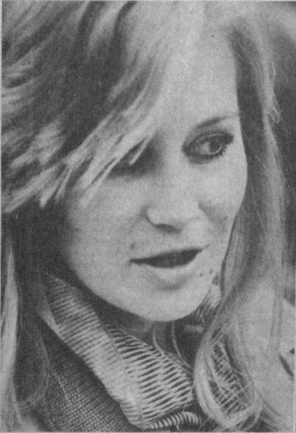
Осень в Ташкенте.