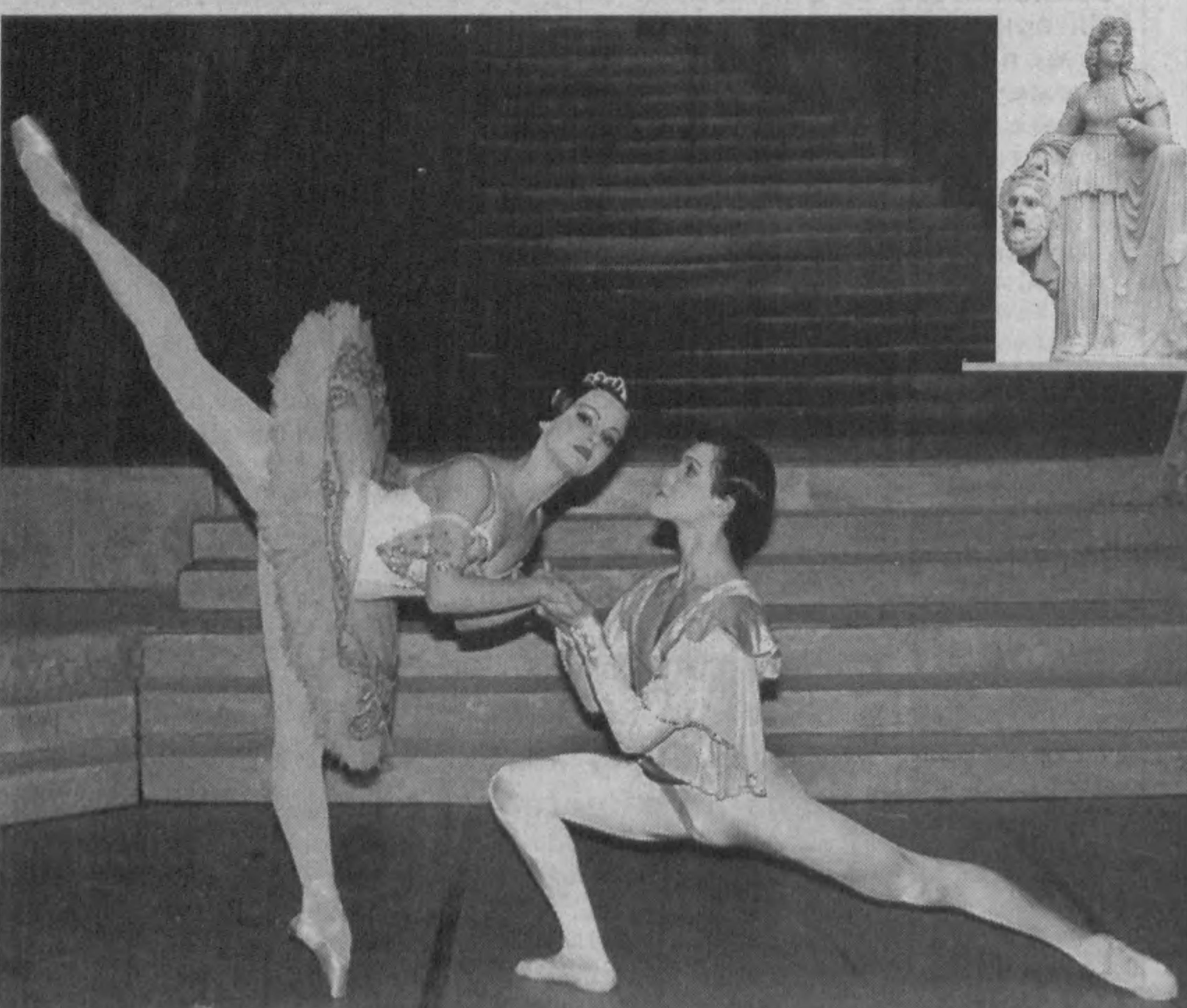
Под семью муз

Подготовил Андрей КИМ при содействии пресс-служб МЧС и ГТК Республики Узбекистан.