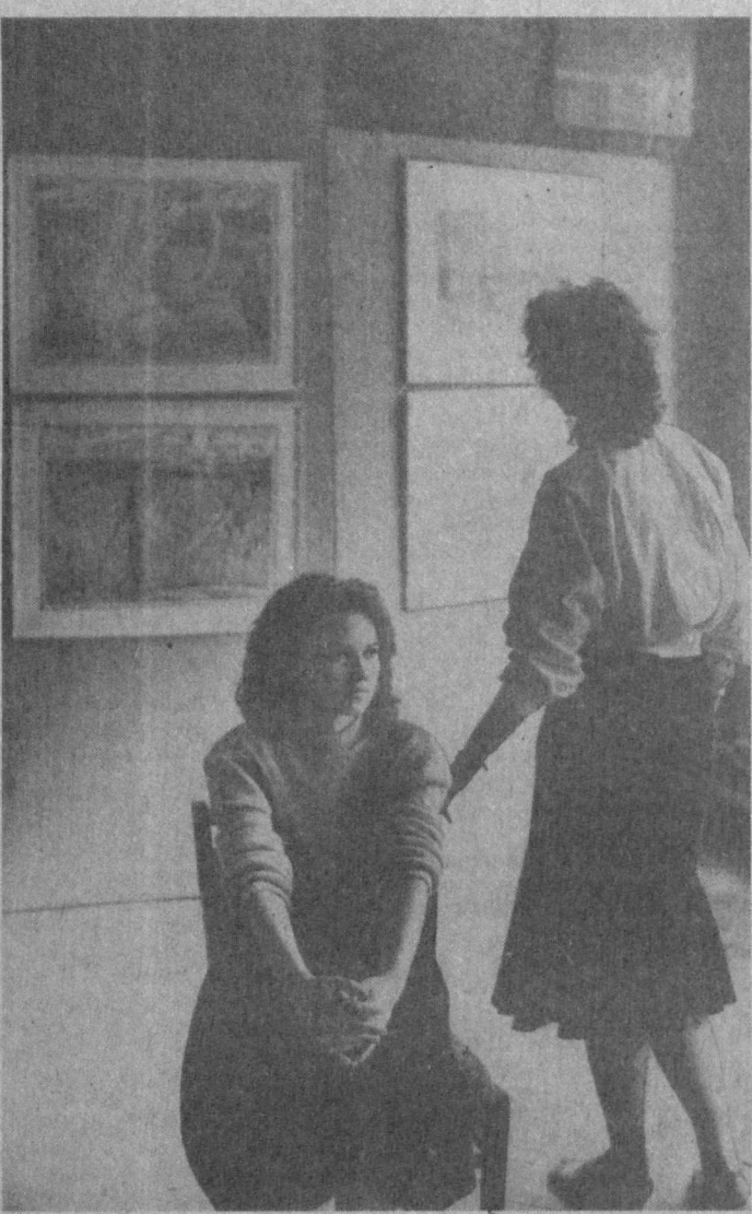
На вернисаже.

— В талоне предупреждений теперь содержится информация о нарушении правил дорожного движения, а также о том, сколько раз водитель нарушал правила. Это позволяет инспектору более точно оценить степень нарушения и назначить наказание.