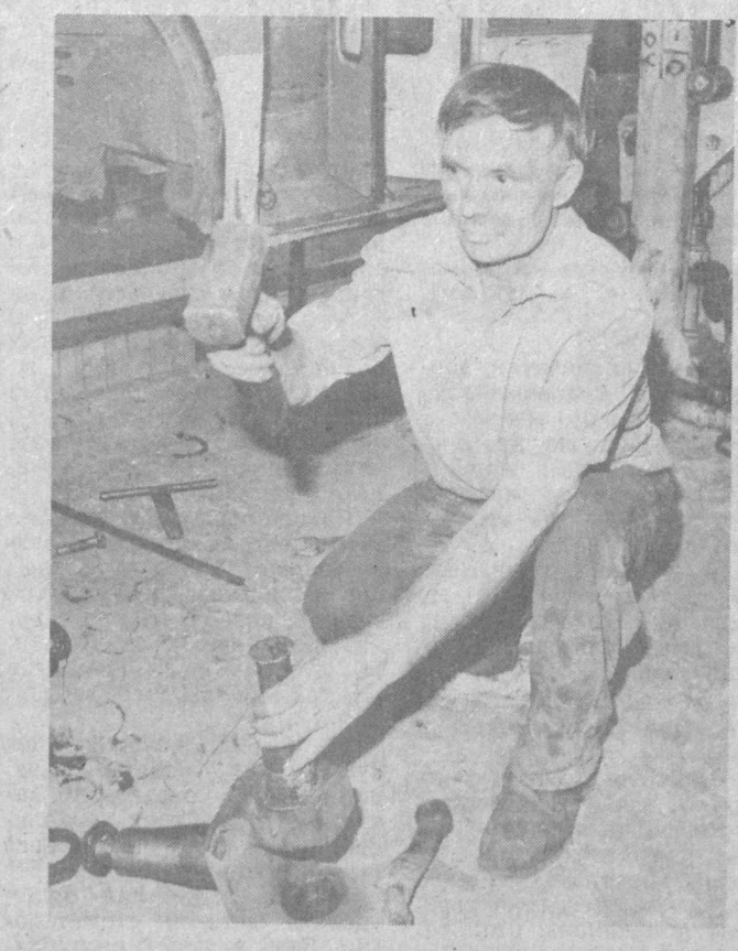
А цены на энергоносители продолжают расти. И когда их космический взлет остановится, сегодня никому не известно. Во всяком случае ясно, что последнее повышение на бензин и дизтопливо, газ и электроэнергию все же далеко не последнее. Однако пока использование электротранспорта в городах республики обходится значительно дешевле автомобильного. Это прекрасно понимают в Государственной ассоциации пассажирского транспорта г. Ташкента. А потому стараются как можно шире, где это возможно, использовать трамваи и троллейбусы. Но и последних в городе не так уж и много. Причем в подавляющем большинстве это старая техника, которая нередко выходит из строя и требует ремонта и тщательного технического обслуживания. Так как на приобретение новых трамваев и троллейбусов необходимы значительные средства, то здесь стараются поддерживать в исправном состоянии имеющийся парк электротранспорта, что, несмотря на постоянную нехватку запасных частей, дефицит резиновых технических изделий, все же удается делать работникам предприятий системы этой ассоциации.

НЕДАВНО «МБА-ИнКа» была преобразована в информационную компанию, учредителями которой стали