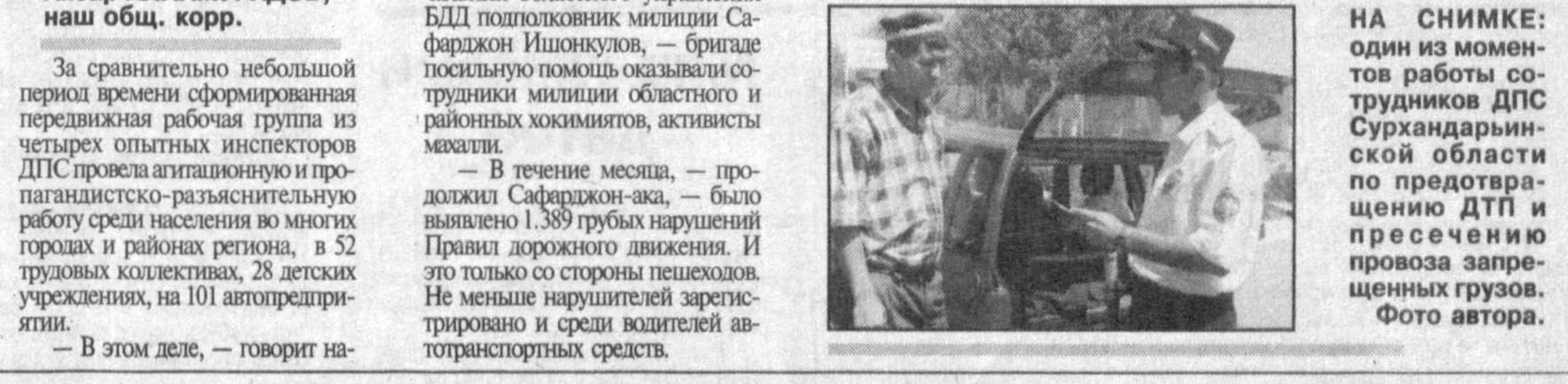
НА СНИМКЕ: один из моментов работы сотрудников ДПС Сурхандарьинской области по предотвращению ДТП и пресечению провоза запрещенных грузов.

Материал подготовлен Управлением государственной регистрации ведомственных нормативных актов Министерства юстиции Республики Узбекистан. С вопросами и предложениями обращаться по тел.: 133-38-67, 132-00-28