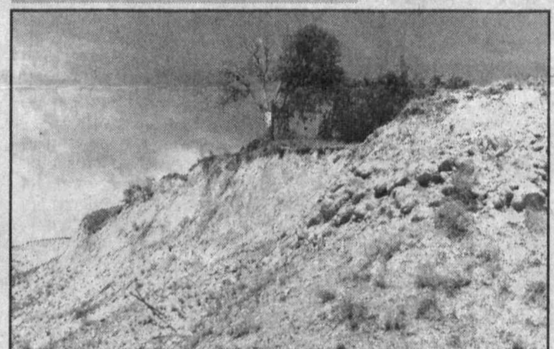
НА СНИМКАХ: вот такая картина сегодня в Хумсана и на берегах реки Угам.

В поселке Хумсан, на берегах реки Угам, на территории Босталыкского района, еще сохранились отдельные живописные уголки. Сберечь их, восстановить загубленную флору и фауну — наш общий долг.