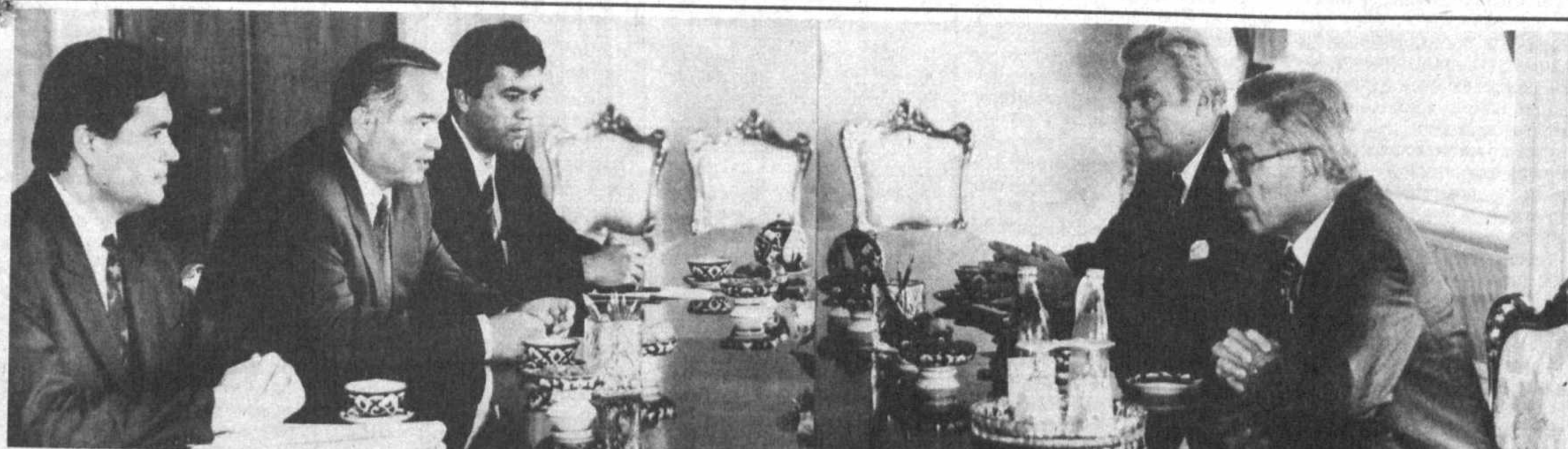
Во время приема.