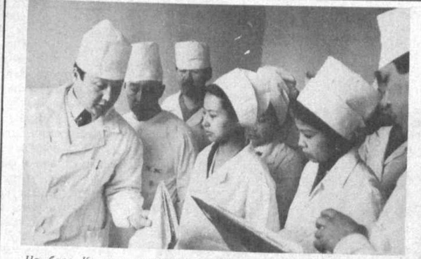
На базе Каракалпакской республиканской больницы № 1 организована кафедра хирургических болезней Каракалпакского филиала Ташкентского педиатрического медицинского института. Новая кафедра оснащена новейшей диагностической аппаратурой, компьютерной техникой. Здесь ведется научная, учебно-педагогическая работа, лечение различных болезней, требующих хирургического вмешательства.