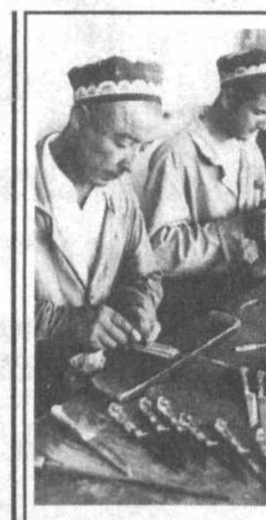
Чист издавна известен своими народными промыслами...