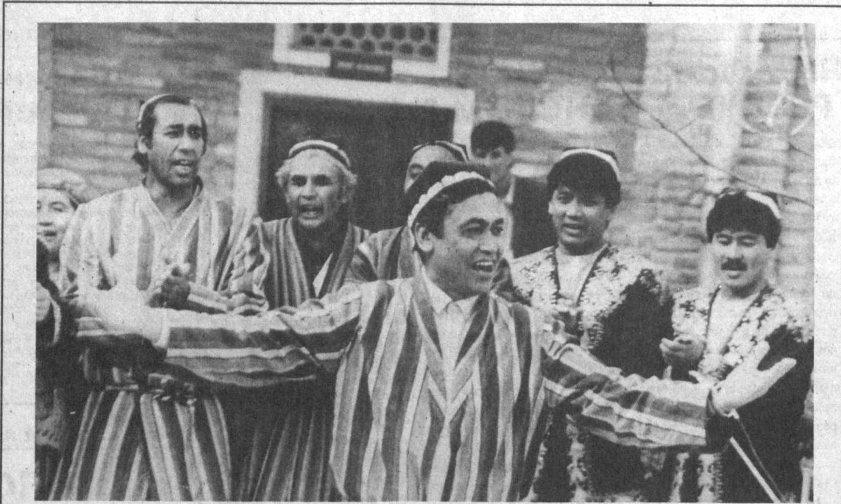
Пою о Родине, о счастье, о любви...