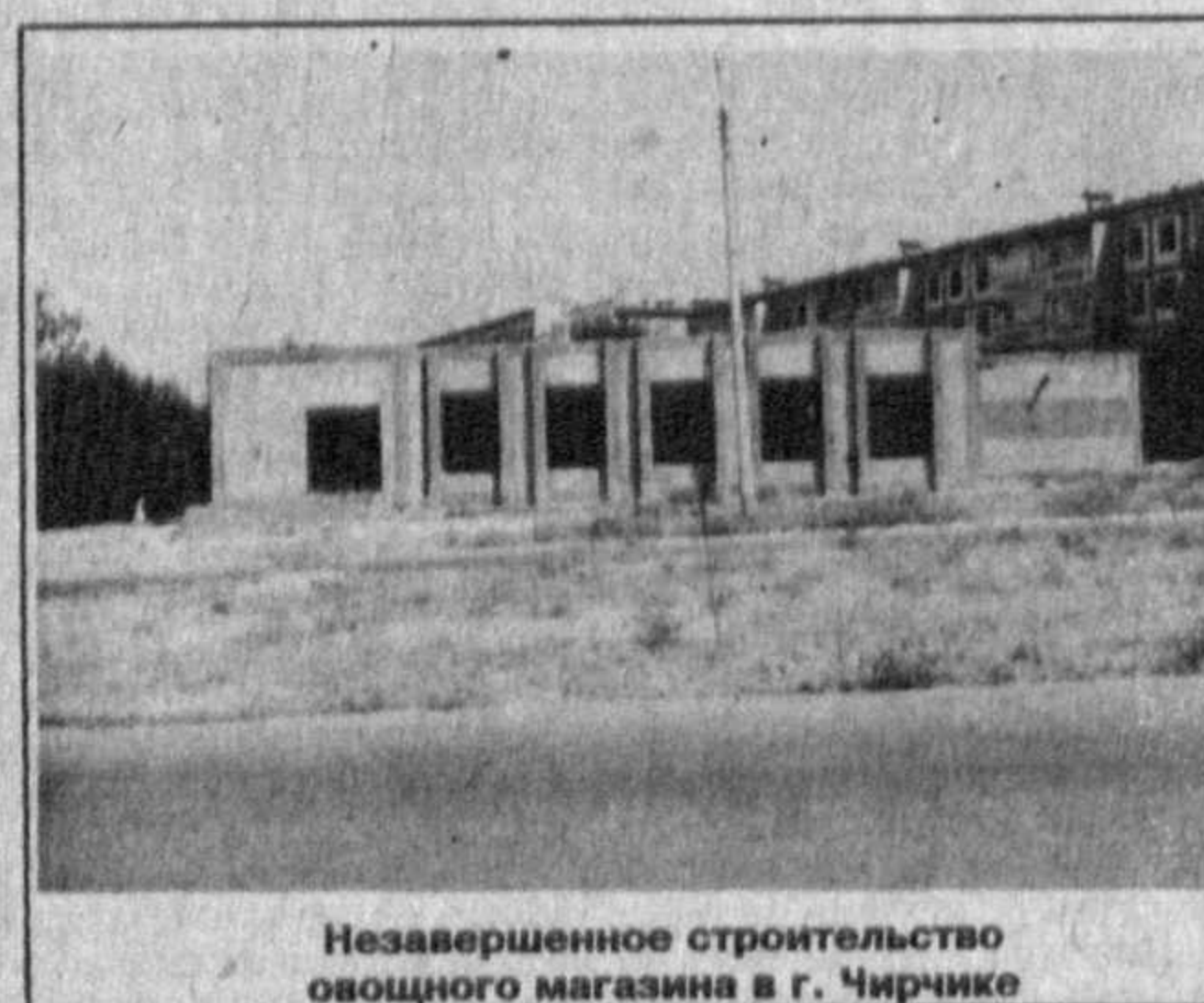
Незавершенное строительство овощного магазина в г. Чирчике

ОПИСАНИЕ ОБЪЕКТОВ, выставленных на аукцион в городе Чирчик. 1. По городу Чирчик: Незавершенное строительство овощного магазина в 10-м микрорайоне города Чирчик. Одноэтажный объект выстроен в каркасно-кирпичной технике с кирпичными перегородками. Общая площадь здания - 791,9 кв. м., в том числе рабочая - 657 кв. м. Для ввода в эксплуатацию требуются отделочные работы. Техническая готовность - 80%, в том числе: земляные работы - 100%, инженерные коммуникации - 100%, монтаж конструкций - 100%. Стартовая цена объекта - 200 тыс. сумов.