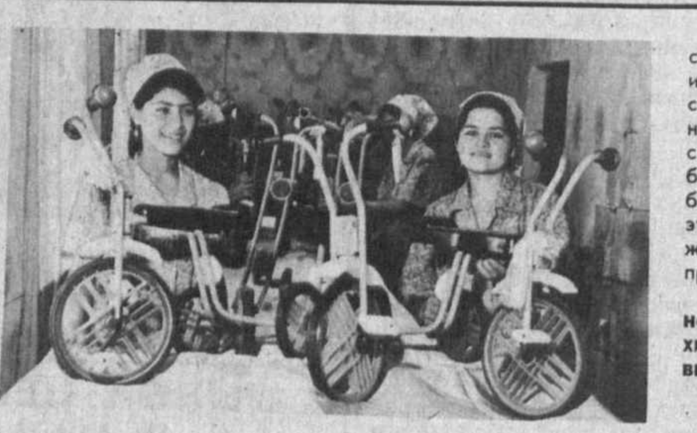
Недавно в райцентре Каршинского района — Бешкенте по инициативе акционерного общества открылся цех по изготовлению детских самокатов и велосипедов.

В области физической культуры и спорта в Узбекистане этот процесс налицо. Характер его и содержание были глубоко проанализированы на недавно состоявшейся республиканской научно-практической конференции "Воспитание здорового поколения — основа строительства великого государства".