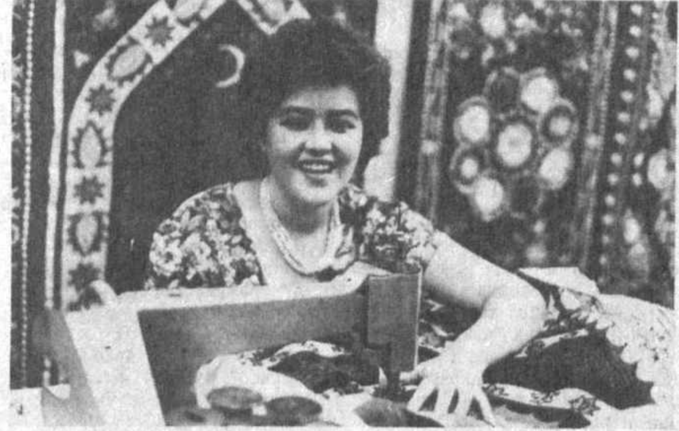
Достоин встретили третью годовщину независимости республики работники пивного акционерного общества "Шарк гули". К этой дате ташкентские мастера изготовили и выпустили в продажу несколько новых видов продукции.