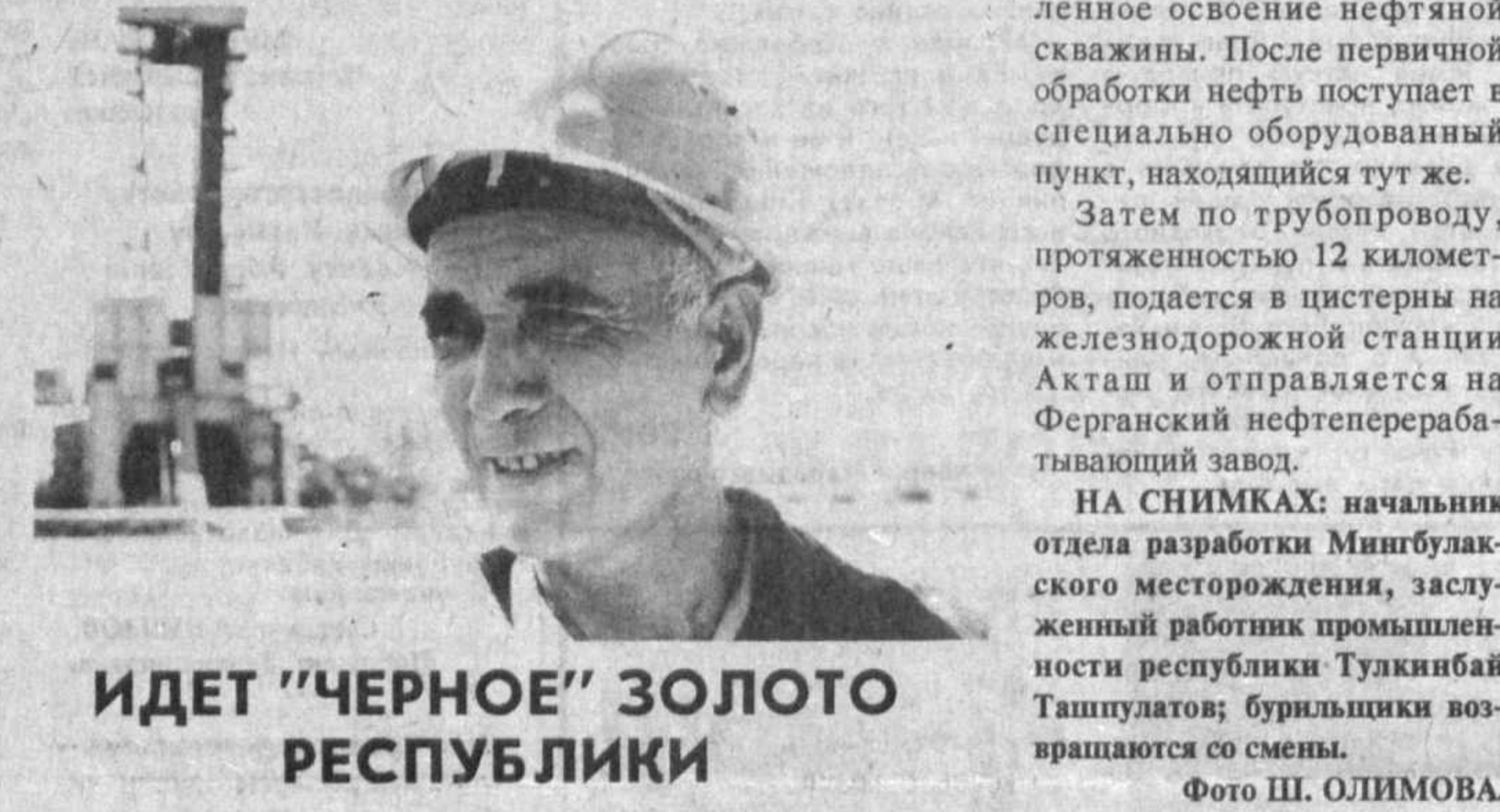
ИДЕТ "ЧЕРНОЕ" ЗОЛОТО РЕСПУБЛИКИ

Деяносто три миллиона долларов — сумма немалая, конечно, но и не очень большая, если помнить, что речь идет о достижении бумажной независимости страны. И. КУЧКАРОВА.