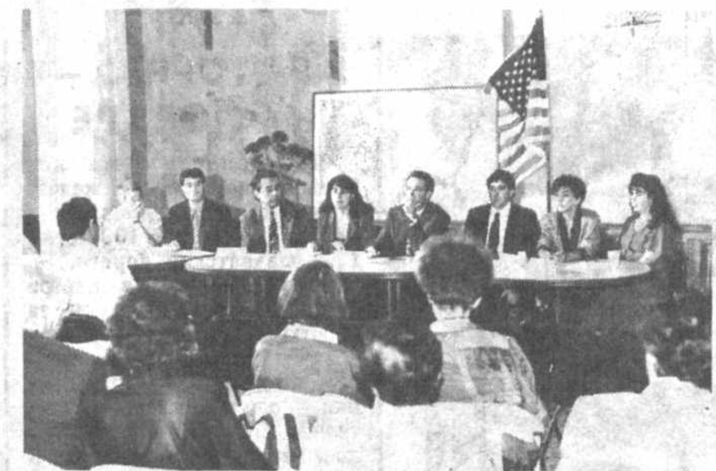
Американская ассоциация АКЕЛС объявила о намерении отправить в 1995-96 учебном году 420 студентов из государства бывшего Союза для учебы в Америке...