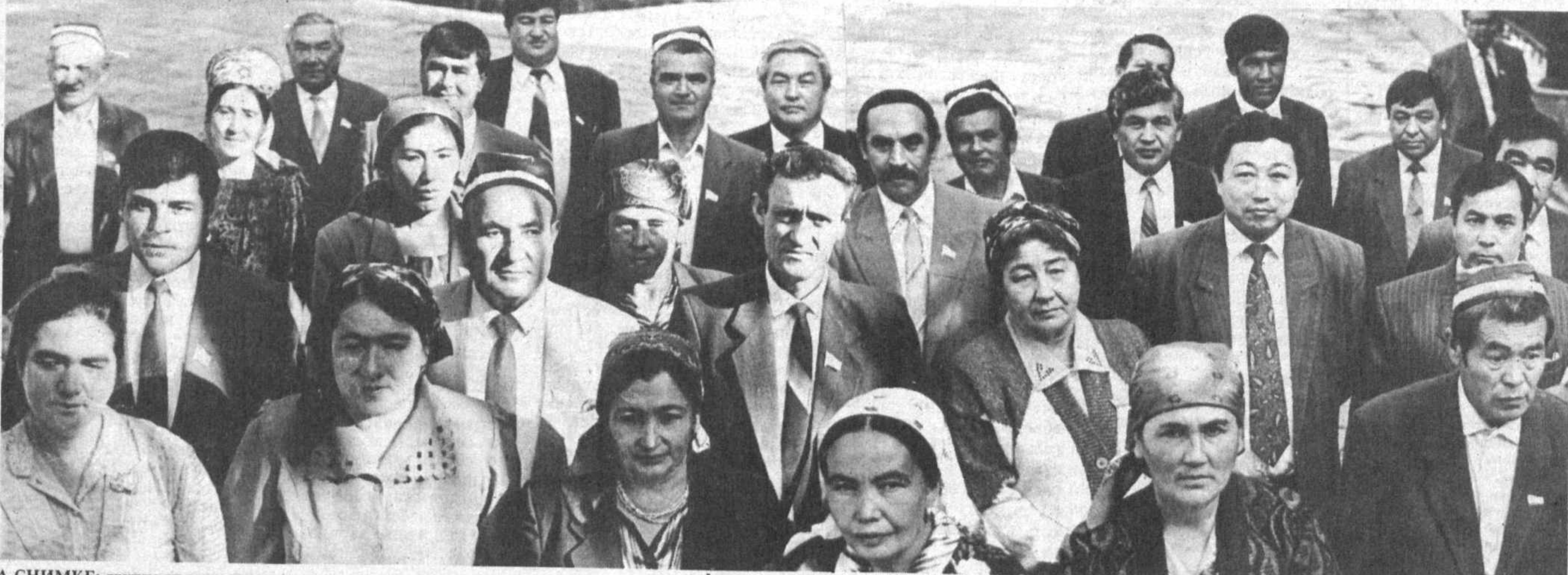
НА СНИМКЕ: группа народных депутатов после завершения работы сессии.

24 СЕНТЯБРЯ СУББОТА № 189 (942) 1991 год В розницу — свободная цена