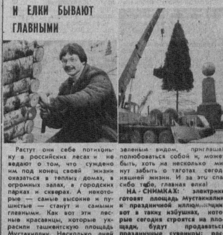
Растут они себе потихоньку в российских лесах и не ведают о том, что суждено им под конец своей жизни оказаться в теплых домах, в огромных залах, в городских парках и скверах. А некоторые — самые высокие и пушистые — станут и самыми главными. Как вот эти лесные красавицы, которые украсили ташкентскую площадь Мустакиллик. Несколько дней они будут радовать детвору и их родителей своим вечнозеленым видом, приглашая полюбоваться собой и, может быть, хоть на несколько минут забыть о тяготах сегодняшней жизни. И за эту сластицу себе, главная елка! — СНИМКАХ: — электрики готовят площадь Мустакиллик и праздничной иллюминации; вот в таких избушках, которые сегодня строятся на площади, будут продаваться праздничные сувениры; растут главные елки Ташкента.

Благодаря принятым мерам огонь удалось остановить. Поэтому четвертый, пятый и шестой энергоблоки действуют в нормальном режиме. На станции создан оперативный штаб по ликвидации последствий пожара, работает государственная комиссия. По ее предварительным заключениям, возгорание — результат неисправности оборудования, вина обслуживающего персонала в этом нет. Для скорейшего