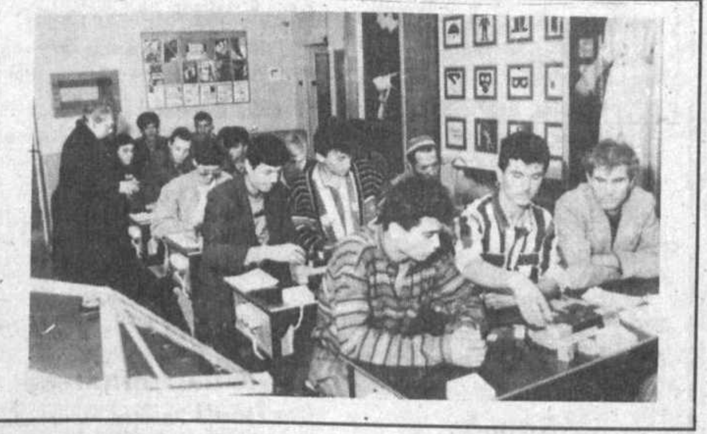
начала учебы курсанты получают право пользоваться ведомственными поликлиникой, больницей, профилакторием, как полноправные работники "Таш-

К словам директора добавлю, что вторая составляющая успешной многолетней работы центра — сложившийся здесь коллектив, насчитывающий вместе с обслуживающим персоналом всего двадцать человек. Здесь работают люди, отмеченные талантом и увлеченные, такие, как старший преподаватель по производству сварочных ра-