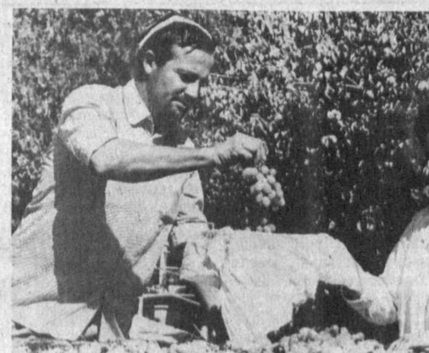
НОВОЙСКАЯ ОБЛАСТЬ. Немалую прибыль получает Кызылтепский район от виноделия. Местный завод вот уже несколько лет подряд выпускает вина известных марок. Поступают они не только в торговую сеть нашей республики, но и за ее пределы. Взамен район получает по бартеру дефицитные материалы из стран Содружества.

ной комиссии по проведению выборов в Олий Мажлис. На сессии выступил государственный советник Узбекистана Т. Алимов. Выборы в Олий Мажлис и местные Советы основываются на демократических принципах и, что самое важное, проводятся на многопартийной основе, подчеркнул он. А коли так, то кандидаты в депутаты должны стремиться оправдать оказанное им высокое доверие, показать свою активность, проявлять инициативу. Ибо избиратели отдадут свои голоса лишь за тех кандидатов, которые добросовестно трудятся на имя нашей свободной Родины, во имя счастья нашего народного имущества. Завоевать доверие народа — это не только большое счастье, но и большая ответственность. (УЗА).