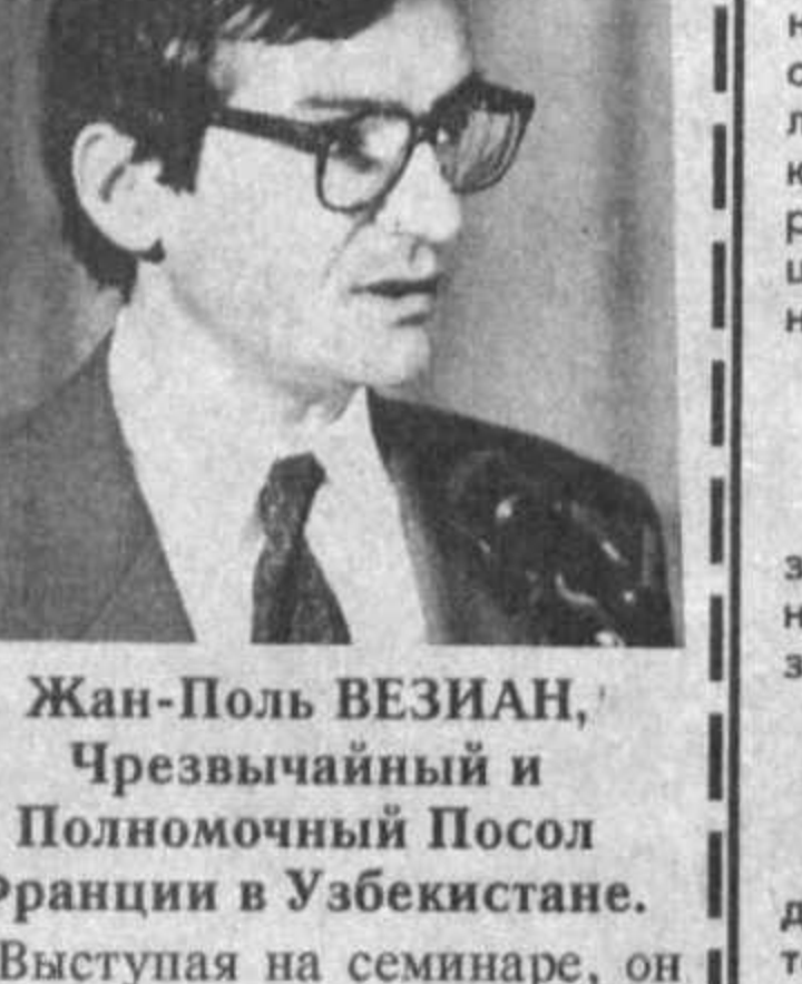
Жан-Поль ВЕЗИАН, Чрезвычайный и Полномочный Посол Франции в Узбекистане. Выступая на семинаре, он рассказал о том, как проходит парламентские выборы во Франции, выразил надежду, что новый парламент Узбекистана, следуя демократическим принципам, будет способствовать дальнейшему развитию республики.

сам становления политической независимости государства Узбекистана и с большим удовлетворением отмечает его последовательные и твердые шаги на пути перехода к рыночной экономике. Я выражаю твердую уверенность в том, что предстоящие выборы в Олий Мажлис являются свидетельством развития политической системы Узбекистана в направлении дальнейшей демократизации общества.