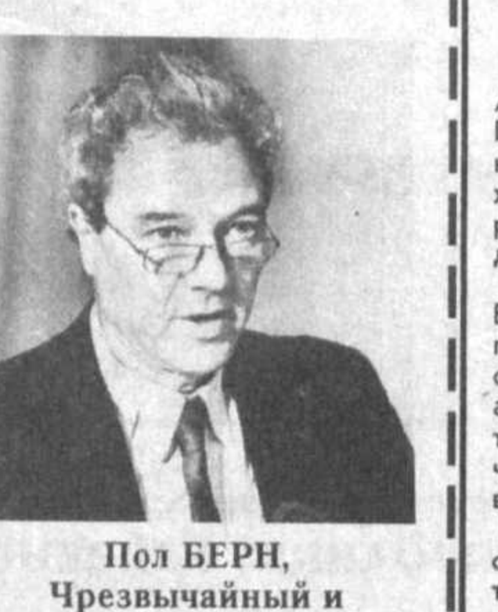
Пол БЕРН, Чрезвычайный и Полномочный Посол Великобритании в Узбекистане: — Я бы хотел пожелать больших успехов вашему правительству и дальнейшей демократизации общества

сам становления политической независимости государства Узбекистана и с большим удовлетворением отмечает его последовательные и твердые шаги на пути перехода к рыночной экономике. Я выражаю твердую уверенность в том, что предстоящие выборы в Олий Мажлис являются свидетельством развития политической системы Узбекистана в направлении дальнейшей демократизации общества.