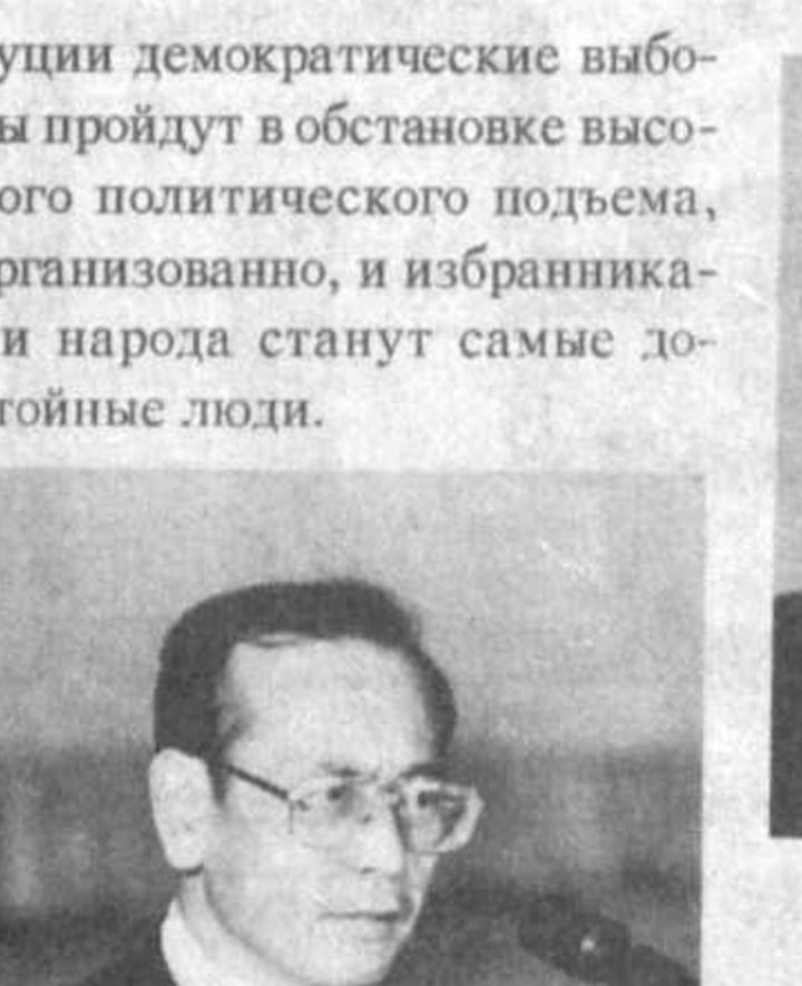
Укеру МАГОСАКИ, Чрезвычайный и Полномочный Посол Японии в Узбекистане: — Япония с большим вниманием относится к процес-

щего в Турции еще не имеет силы. председателями окружных избирательных комиссий по выборам в Олий Мажлис оказались очень своевременным. Он должен способствовать глубокому пониманию задач, стоящих перед организаторами выборов. В ходе семинара были высказаны различные мнения, предложения. Многие почерпнули для себя, например, представители хокимиятов. Аксакалы махаллей, их активно широко развернули подготовительную, разъяснительную работу среди населения. Они рассказывают об особенностях нынешних выборов. Мы верим, что первые после принятия новой Конституции