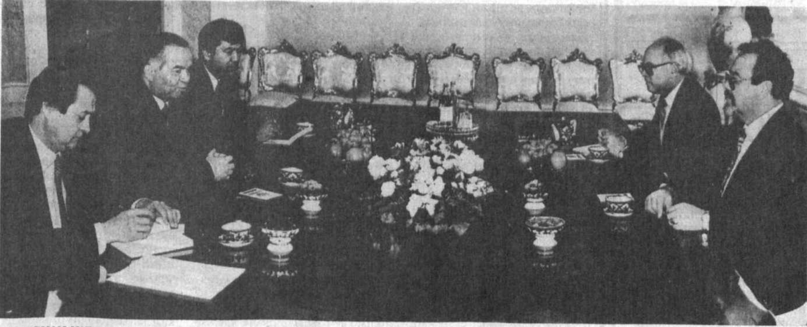
НА СНИМКЕ: во время приема.