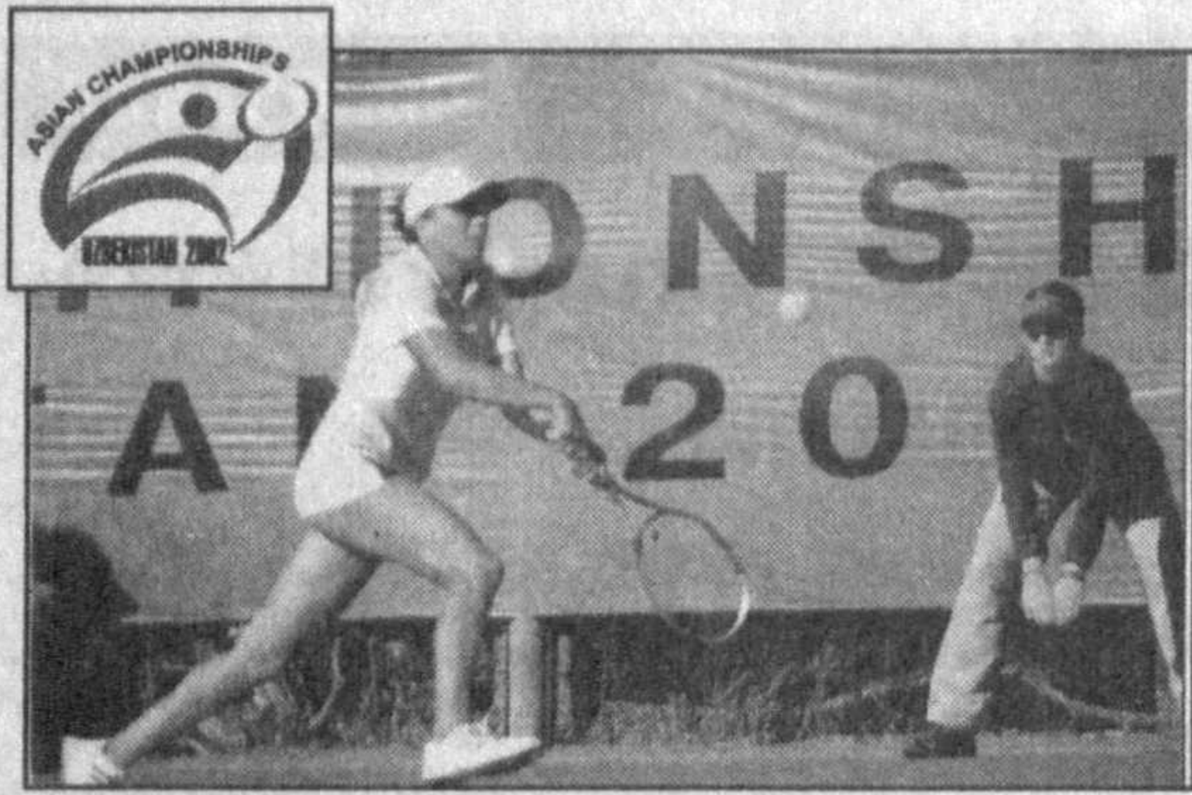
Чисто индонезийским финалом в смешанном разряде в субботу и победным японским дублем в одиночках в воскресенье на кортах Ташкентского теннисного центра финишировал XXX чемпионат Азии по теннису.