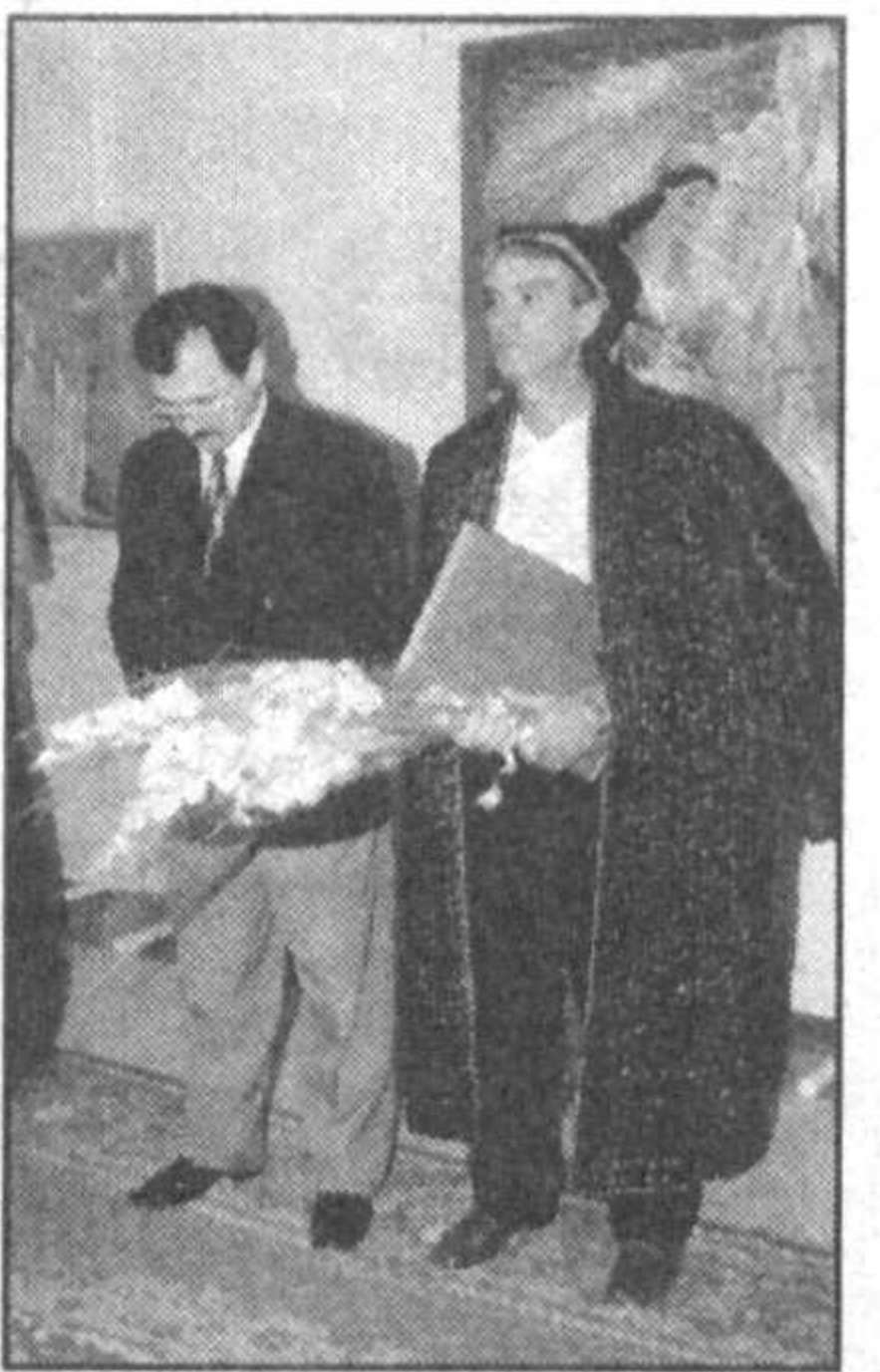
стами наделен и сам Гусейнов, что позволило ему создать яркие сценические образы.

спектаклей. Многие героини живописца — балерины или танцующие женщины. В этих работах ощущается легкость, плавность движений, воздушность пространства. И чем-то балетные серии художника напоминают известные картины Э. Дега и З. Серебряковой. Как оказалось, Дега — один из кумиров Ю. Гусейнова. А еще он очень чтит своих учителей — известных мастеров Чингиза Амарова и Георгия Брима. Именно они привили Гусейнову умение чувствовать театр, ведь декоратор, обладая тонким художественным вкусом, должен увидеть спектакль целостно. Этими качествами и способно-